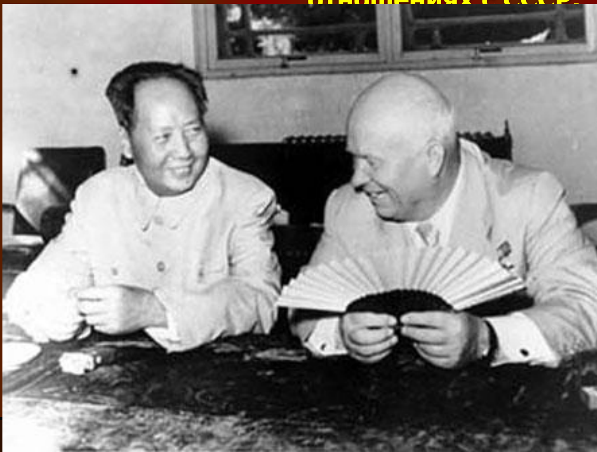
Хрущёв и китайский «Сталин» Мао Цзедун.

XX съезд ударил и в отношениях с Китаем. Китайское руководство сравнило СССР с США, за разоблачение преступлений Сталина. Отношения настолько обострились, что несколько раз происходили военные столкновения на границе. Теперь столкнулись два крупнейший коммунистических государства. Китай устал от роли «младшего брата» в отношениях с СССР.