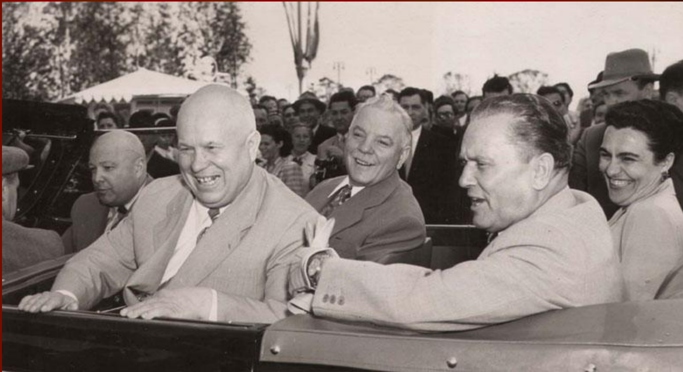
Визит Хрущёва в Югославию и встреча с президентом маршалом И.Тито.

В это время несколько улучшились отношения с Западом. Ядерное оружие приостановило возможность прямого столкновения США и СССР. В эти годы было заключено перемирие по Корее, СССР вывел войска из Австрии (1954 г.), мирный договор подписан с ФРГ, состояние войны прекратилось с Японией (1954 г.). Улучшились отношения с Югославией.