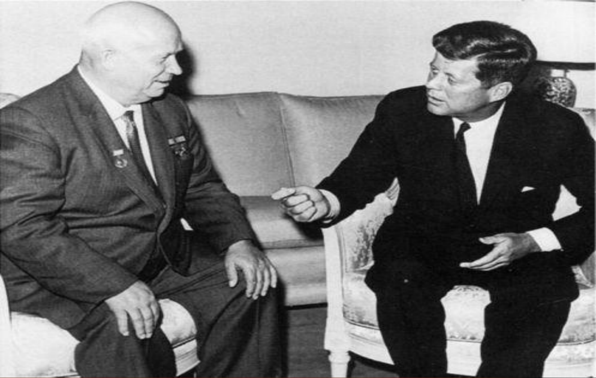
Хрущёв и президент США Джон Кеннеди на встрече.