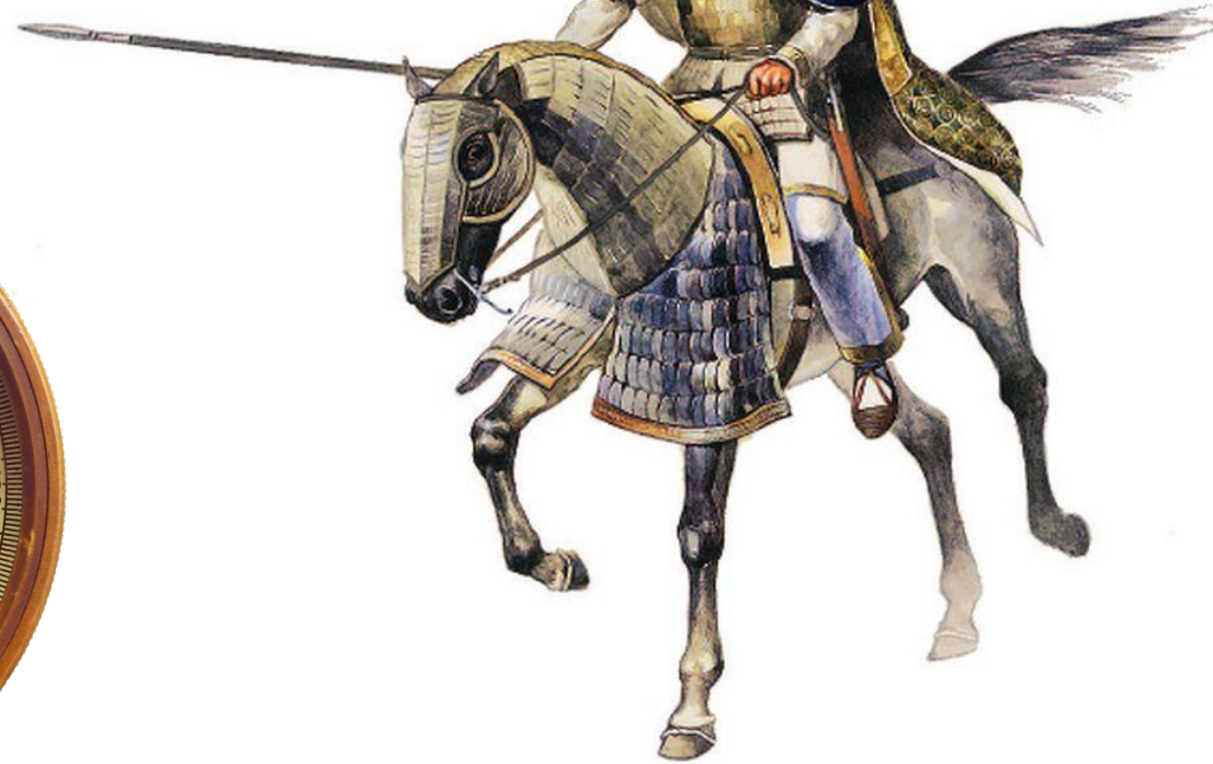
Византийский тяжеловооруженный всадник-катафракта V-VI вв.