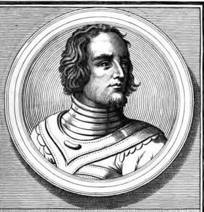
ALARICO SEGUNDO REY DE LOS GODO, ELEGIDO EN EL AÑO 382 D CHRISTO, REYNÓ 28 AÑOS MURIÓ EN CA- LABRIA EL AÑO 410.

Мечтая завладеть сокровищами Рима, Аларих, вождь германского племени готов двинул свои войска на Рим. К ним стали присоединяться рабы и колонны, показывали готам тайники, где римляне прятали хлеб и оружие.