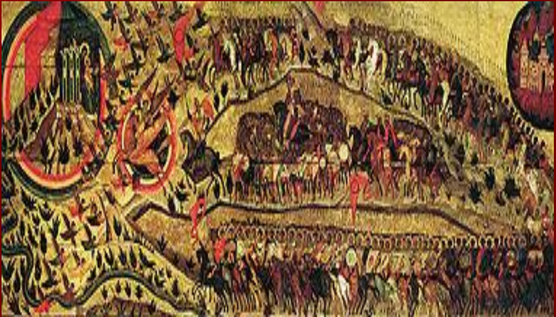
Икона « Благословенно воинство Небесного Царя », написанная в память Казанского похода 1552 года