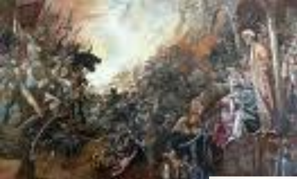
И. Файзуллин "Оборона Казани "