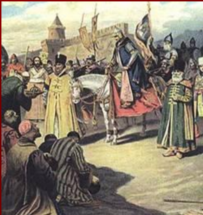
П.И. Коровин. Взятие Казани.