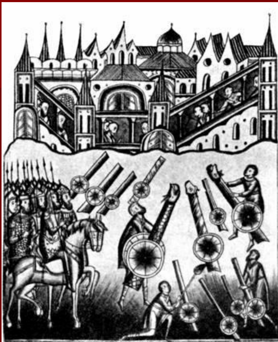
Осада Казани. Из Казанского летописца.

Второй поход (осень 1549 — весна 1550 ). В марте 1549 года Сафа-Гирей внезапно скончался. Приняв казанского гонца с просьбой о мире, Иван IV отказал ему, и начал собирать войско. 24 ноября он выехал из Москвы, чтобы возглавить войско. Соединившись в Нижнем Новгороде, войско двинулось к Казани и 14 февраля было у её стен. Казань не была взята; однако при отходе русского войска недалеко от Казани, при впадении в Волгу реки Свияги было решено возвести крепость. 25 марта царь вернулся в Москву. В 1551 году всего за 4 недели из тщательно пронумерованных составных частей была собрана крепость, получившая название Свияжск ; она послужила опорным пунктом для русского войска во время следующего похода.