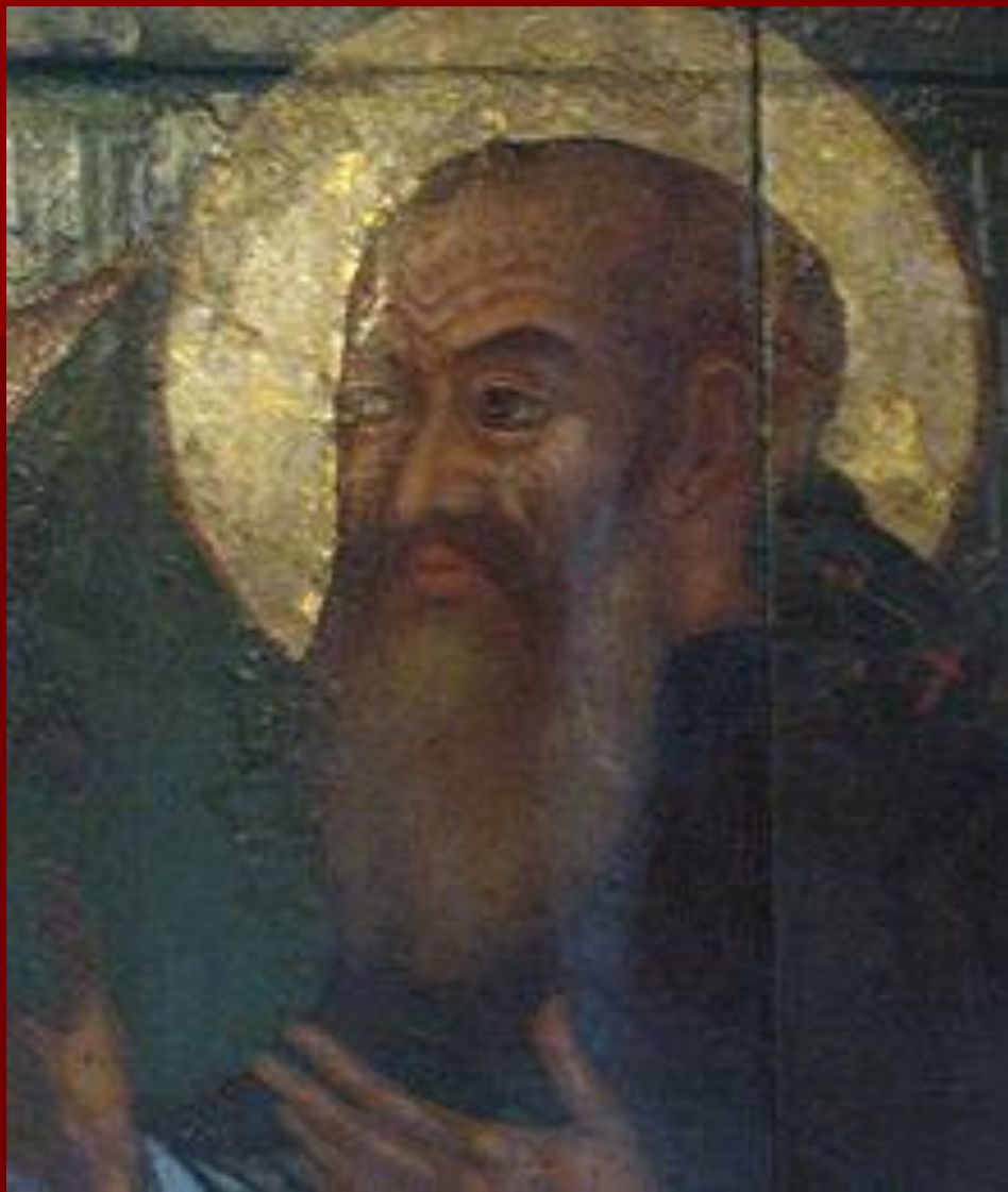
Василий III , отец Ивана IV

Неудачный поход русского войска на Казань в начале 16 века показал правительству Василий III , что необходимо спешно крепить порубежную крепость Нижнего Новгорода. Тогда же началась заготовка кирпича, белого камня, извести, железа и строевого леса, чтобы в возможно короткий срок над слиянием Оки с Волгой поднять неприступной твердыней Нижегородский каменный кремль.