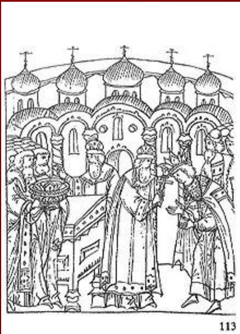
Венчание на царство Ивана IV, январь 1547 г.