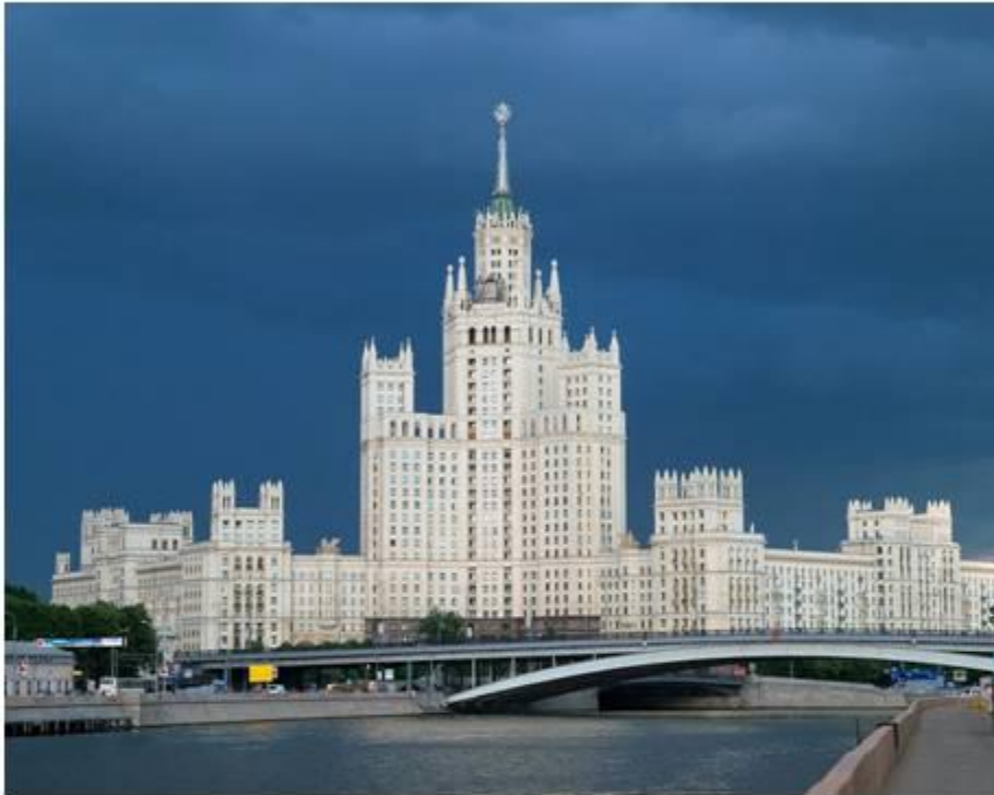
Жилой дом на Котельнической набережной