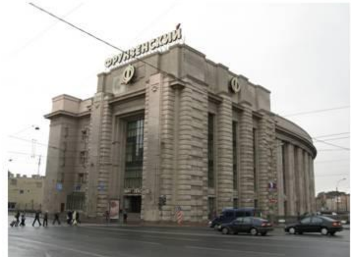
Универмаг «Фрунзенский» в Санкт-Петербурге