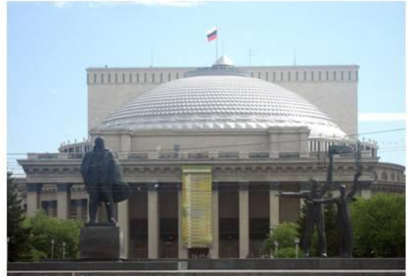
Новосибирский оперный театр