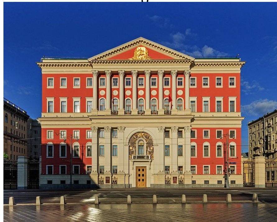
здание Моссовета на Тверской улице