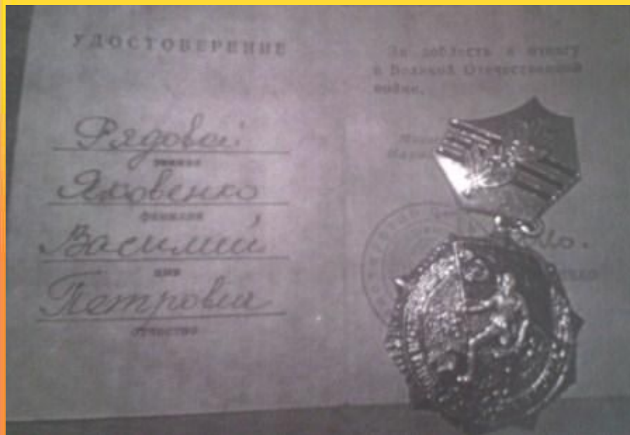
Медаль "ЗА ДОБЛЕСТЬ И ОТВАГУ В ВЕЛИКОЙ ОТЕЧЕСТВЕННОЙ ВОЙНЕ ."

Послевоенные годы были очень трудными, он работал в колхозе опять так же самоотверженно, как и воевал на войне. За это также был награжден множеством наград.