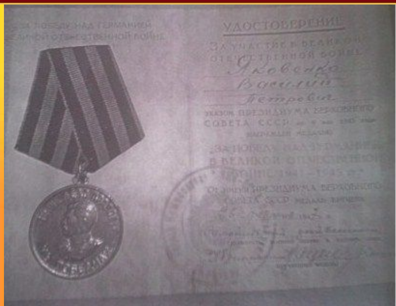
Медаль “ЗА ПОБЕДУ НАД ГЕРМАНИЕЙ В ВЕЛИКОЙ ОТЕЧЕСТВЕННОЙ ВОЙНЕ 1941-1945 гг.”