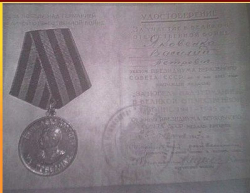
Медаль “ЗА ПОБЕДУ НАД ГЕРМАНИЕЙ В ВЕЛИКОЙ ОТЕЧЕСТВЕННОЙ ВОЙНЕ 1941-1945 гг.”