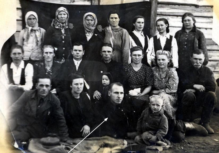
Дедушка накануне войны среды родственников