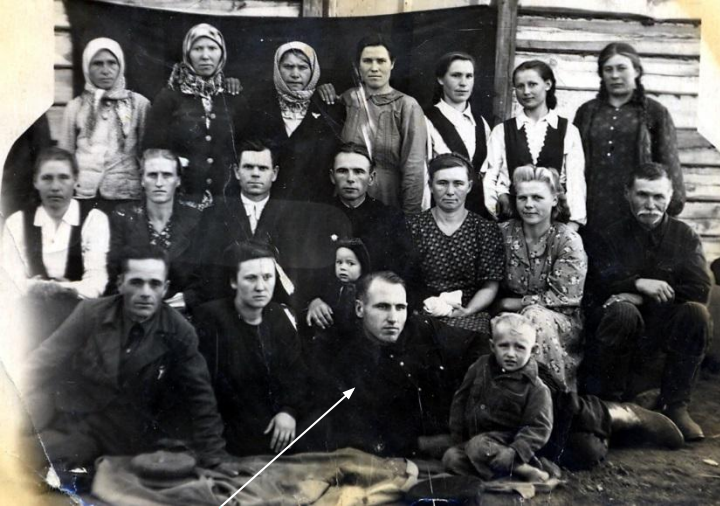
Дедушка накануне войны среды родственников