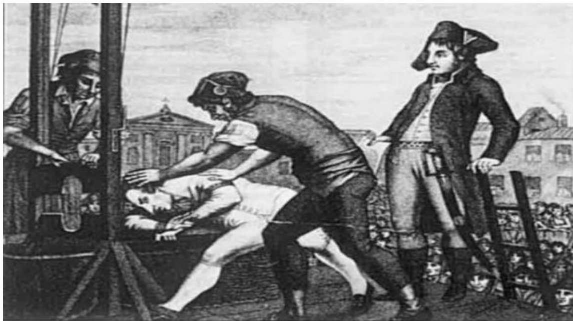
Казнь Максимилиена Робеспьера (10 термидора II года) 28 июля 1794