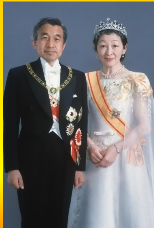
Акихито и его супруга