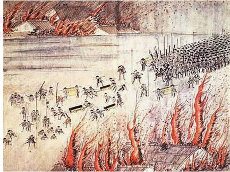
Подавление восстания. Осака в огне

Чиновники же скупали рис и отправлял его в Эдо для проведения церемонии провозглашения нового сёгуна.