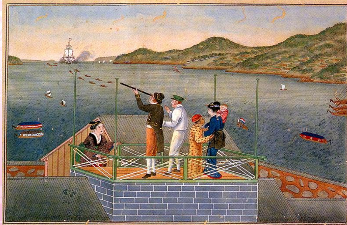
Японская гравюра изображает голландцев с телескопом в гавани Нагасаки

Японцы не дали прямого ответа. Но спустя год Перри вернулся к японским берегам с более мощной эскадрой. В результате Японии пришлось подписать торговый договор вначале с США в марте 1854 г., а затем с Англией, Россией, Голландией, Францией и Пруссией.