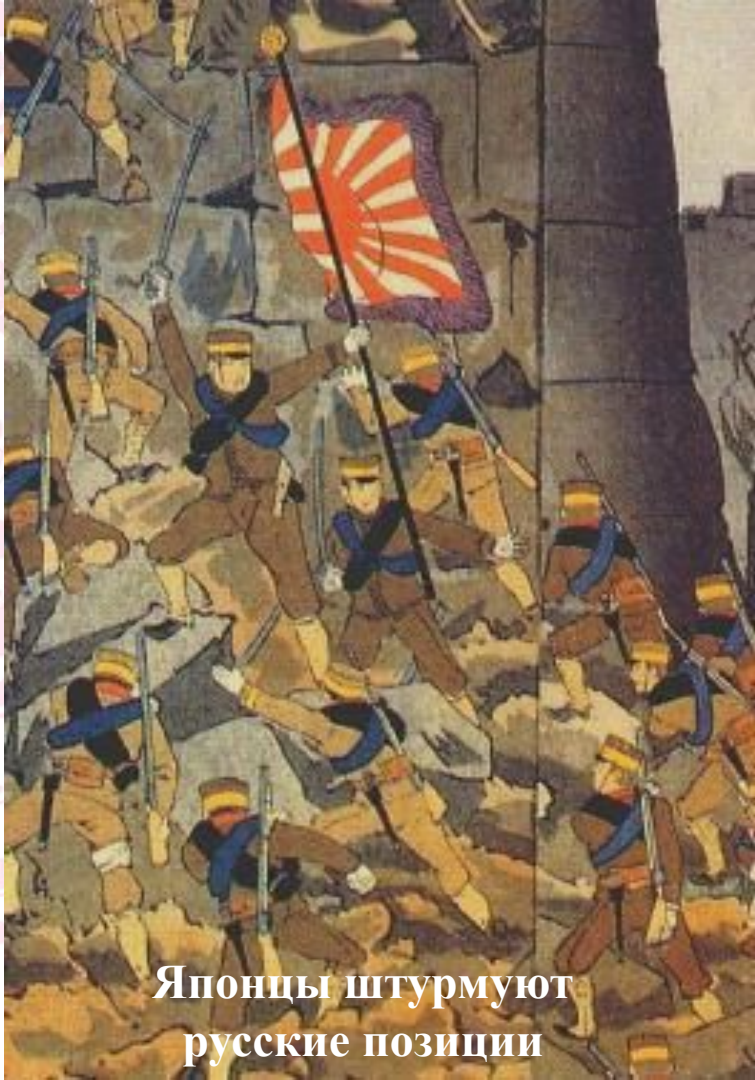
Японцы штурмуют русские позиции

В к. XIX в. началась борьба за передел мира. Япония неожиданно превратилась в «хищника». В 1894-1895 гг. в результате японо-китайской войны японцы получили Корею и Манчжурию, но там ее интересы пересеклись с русскими.