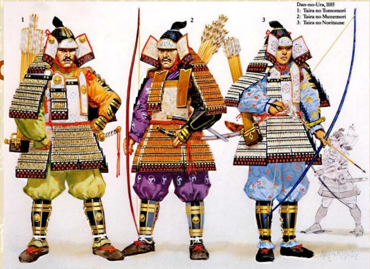
Dan-no-Ura, 1185 1: Taira no Tomomori 2: Taira no Munemori 3: Taira no Noritsune