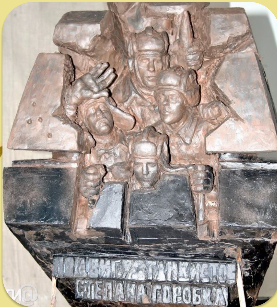
Памятник экипажу Степана Горобца в сквере на Комсомольской площади г. Твери