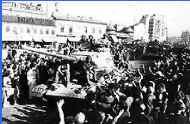
Советские войска вошли в Бухарест 31 августа 1944, через 2 дня после окончания операции.

Наступление советских войск на внешнем фронте все более нарастало. Войска Второго Украинского фронта развивали успех в сторону Северной Трансильвании и на фокшанском направлении, 27 августа заняли Фокшаны и вышли на подступы к Плоешты и Бухаресту. Соединения 46-й армии Третьего Украинского фронта, наступая на юг по обоим берегам Дуная, отрезали пути отхода разбитым немецким войскам к Бухаресту. Черноморский флот и Дунайская военная флотилия содействовали наступлению войск, высаживали десанты, наносили удары морской авиацией. 28 августа были взяты города Брэила и Сулина, 29 августа - порт Констанца. В этот день была завершена ликвидация окруженных войск противника западнее реки Прут. На этом Яско-Кишинёвская операция завершилась.