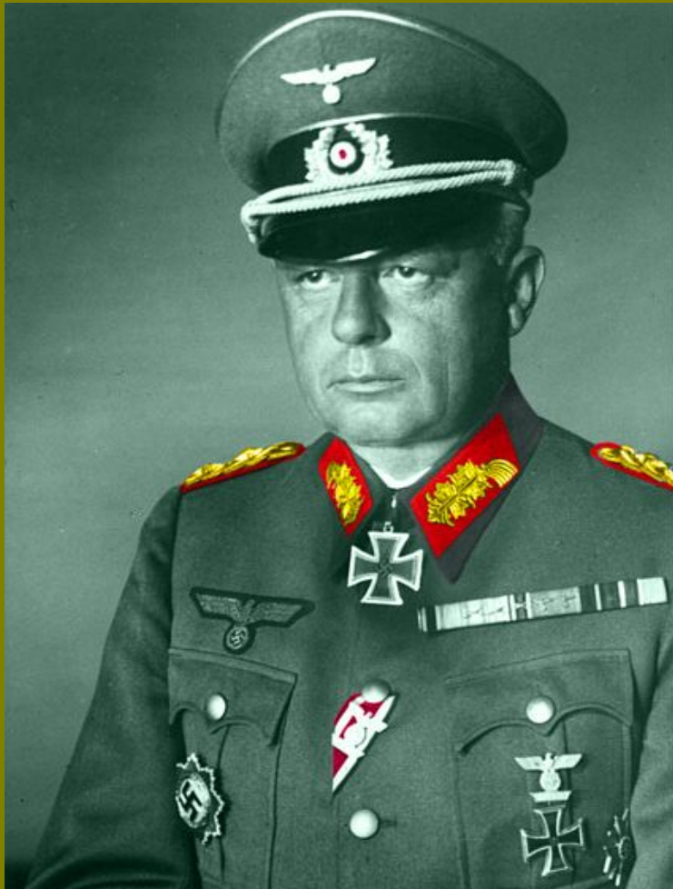
Командующий группой армий « Южная Украина» Генерал – оберст Ганс Фриснер

Перед советскими войсками оборонялась группа армий «Южная Украина» под командованием генерал-полковника Фриснера, включавшая в себя 25 немецких и 22 румынских дивизий. «Яско-Кишиневская операция» привела к полному уничтожению группы армий "Южная Украина", освобождению Молдавии, капитуляции Румынии. Штаб группы армий «Южная Украина» во главе с генерал-полковником Фриснером, потеряв связь с войсками, 23 августа бежал из Галаца в Карпаты.