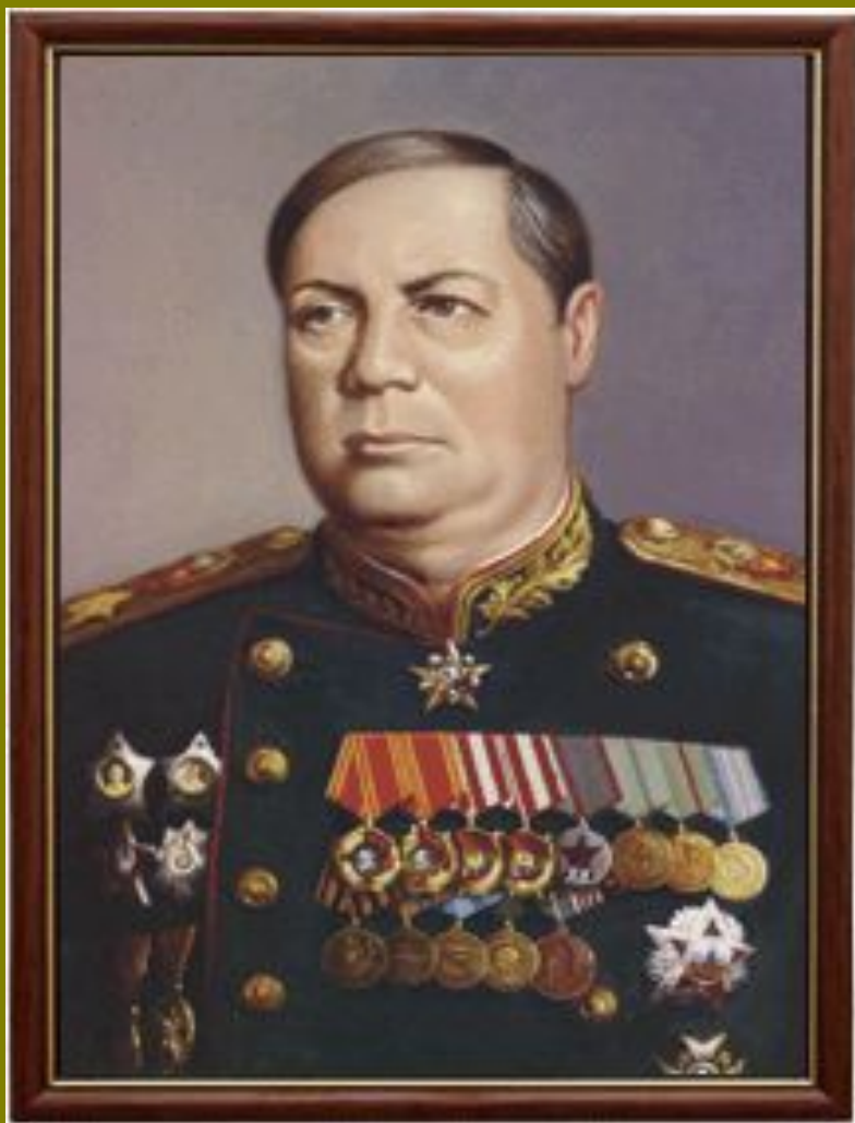
Командующий 3 украинским фронтом Фёдор Иванович Толбухин

В Красной Армии с 1918; сражался на фронтах Гражданской войны. Был награжден орденом Красного Знамени. В годы войны, командовал армией, фронтом. Весной 1943 года Толбухин стал командующим Южным, с мая 1944 и до конца войны — 3-м Украинским фронтом. В августе 1944 совместно с войсками Р. Я. Малиновского разгромили группу армии «Южная Украина» в «Яско-Кишиневской операции». 12 сентября 1944 года – маршал Советского Союза.