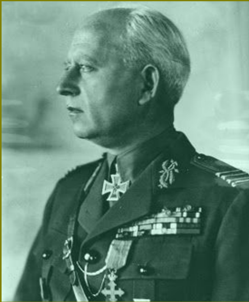
Командующий 3 румынской армией генерал Петру Думетреску

После начала «Яско-Кишинёвской операции» 1944 года армия была сбита с занимаемых рубежей по Днестру. Думитреску отступал к Бухаресту, избегая при этом столкновений с советскими войсками. Но советские войска настигли 3-ю армию, когда остатки 3-й армии подошли к Бухаресту, в плен попало около 130 000 румынских солдат. 23 августа Румыния вышла из войны, и Думитреску повернул оружие против немцев, захватив в плен около 6 000 немецких солдат.