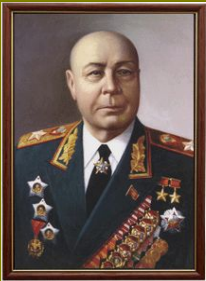
Маршал Советского Союза - Тимошенко Семён Константинович

Маршал, дважды Герой Советского Союза. Советский государственный и военный деятель, полководец. С августа 1944 года и до конца войны командовал 2, 3 и 4 Украинскими фронтами. При его участии был разработан и проведён ряд крупнейших операций Великой Отечественной войны, в том числе «Яско-Кишинёвская». Газета «Правда» 13 сентября 1944 года отмечала, что эта операция явилась одной «из самых крупных и выдающихся по своему стратегическому и военно-политическому значению в нынешней войне».