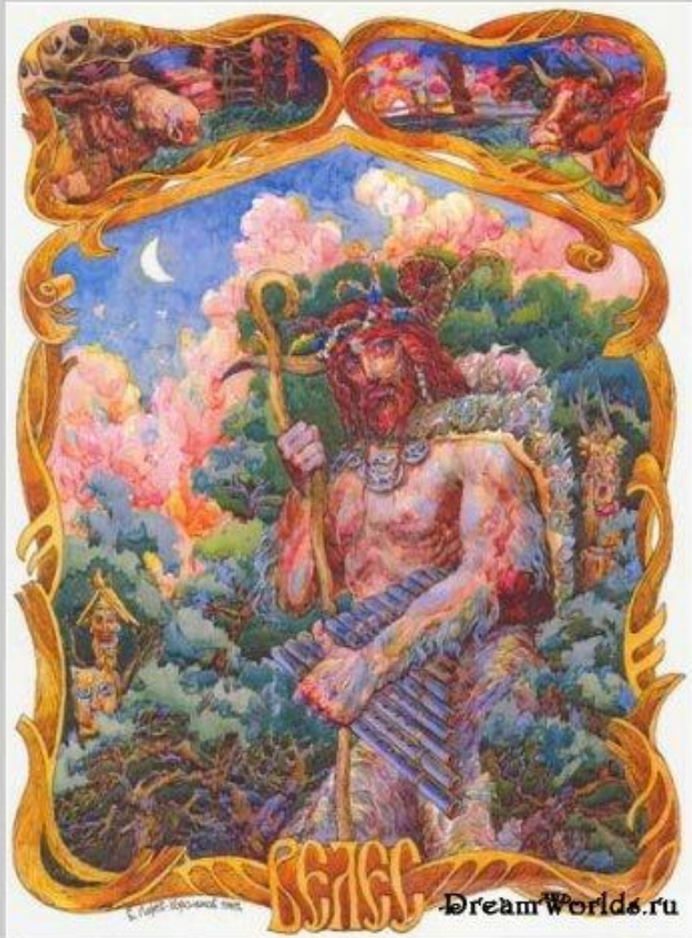
Художник: Корольков В.

Ключ к пониманию Волоса-Велеса надо искать в наименовании его богом скота, «скотым богом», то есть покровителем домашних животных. Именно к нему следовало обращаться с просьбами о благополучии скотины, об избавлении ее от болезней. Ему приносили в жертву коней, быков, овец. Он играл какую-то роль в обряде сжигания «коровьей смерти», совершавшемся для прекращения падежа скота.