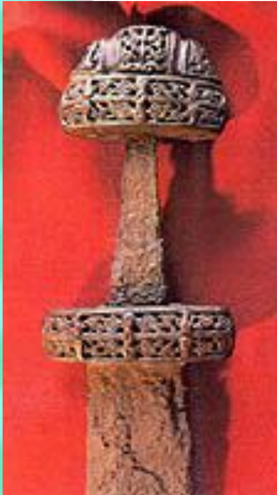
Боевой меч 9 века