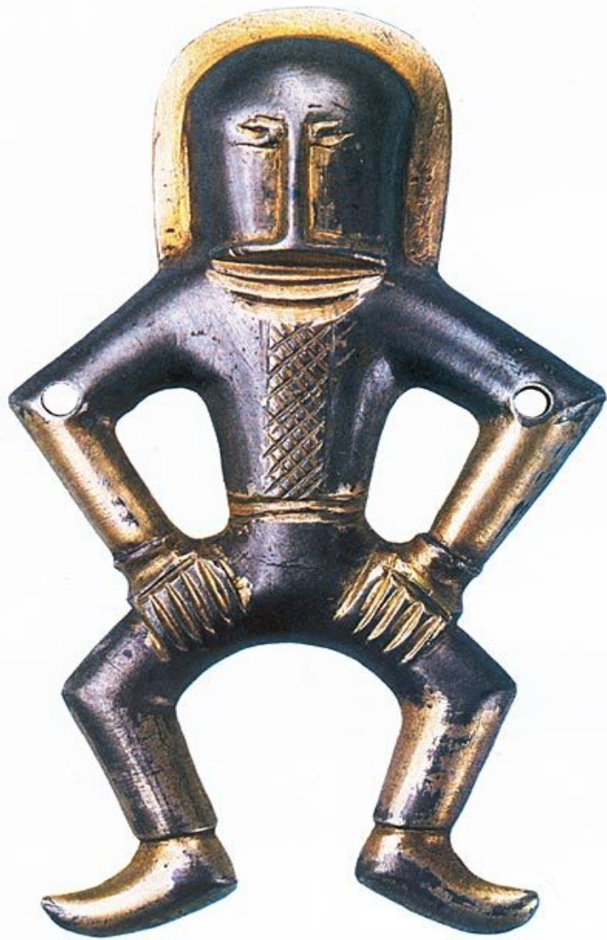
Статуэтка антского воина

После падения державы гуннов вновь наполняются славянским населением дунайские и днепровские берега. В V—VI вв происходит его быстрое и громадное увеличение. Начиная с V в. в бассейнах Днепра и Днестра складывается мощный союз восточнославянских племен, которых называли антами , что на древнеиранском языке означало «жители окраин». Одновременно на севере Балканского полуострова образовался племенной союз склавинов .