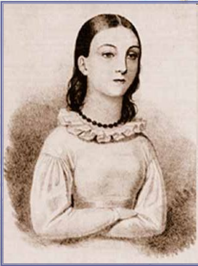
.. Портрет Надежды Дуровой в 14 лет. Неизвестный художник