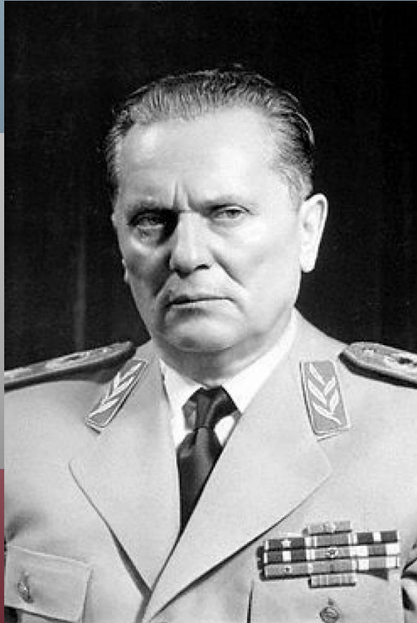
Иосип Броз Тито