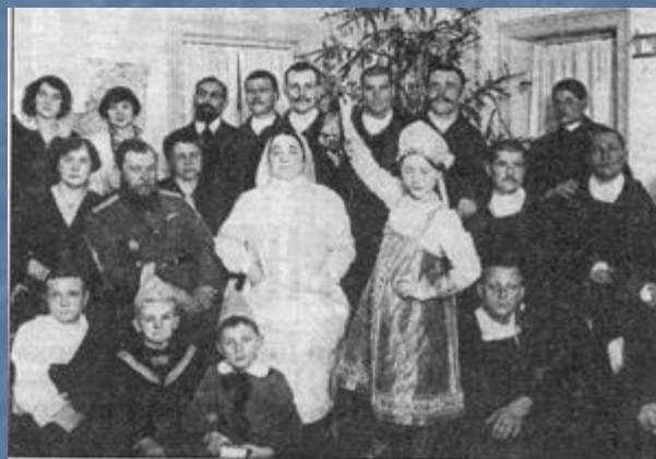
Дети Ф.И. Шаляпина организовали концерт для раненых