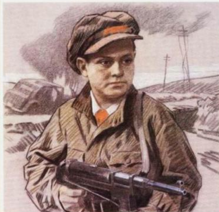
ПРИСВОЕНО звание Героя Советского Союза