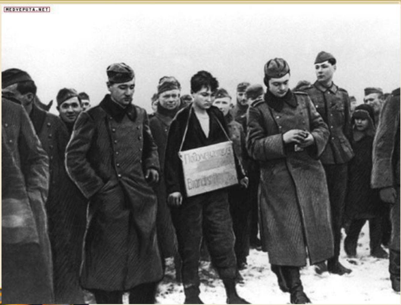
Зою Космодемьянскую ведут на казнь