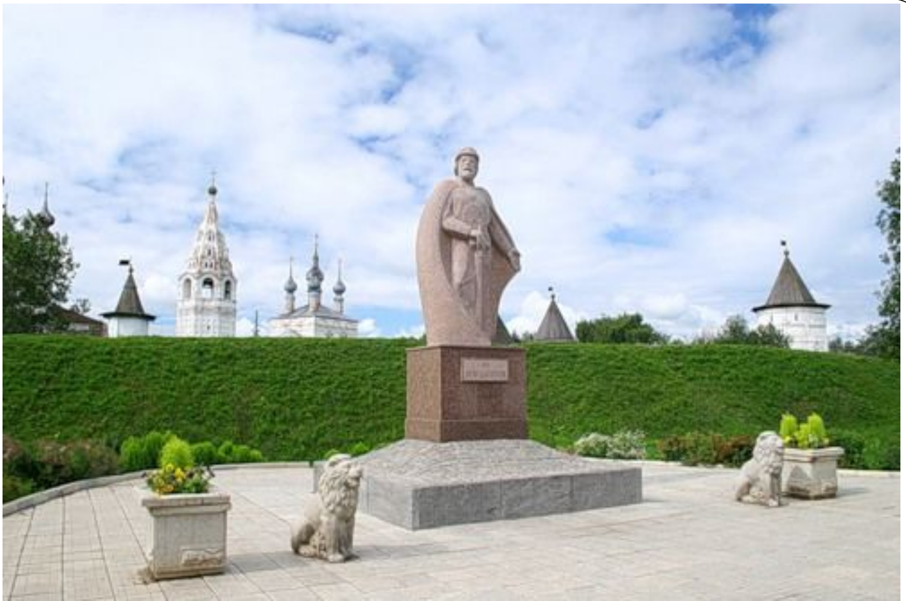
Памятник Юрию Долгорукому - основателю Юрьева-Польского