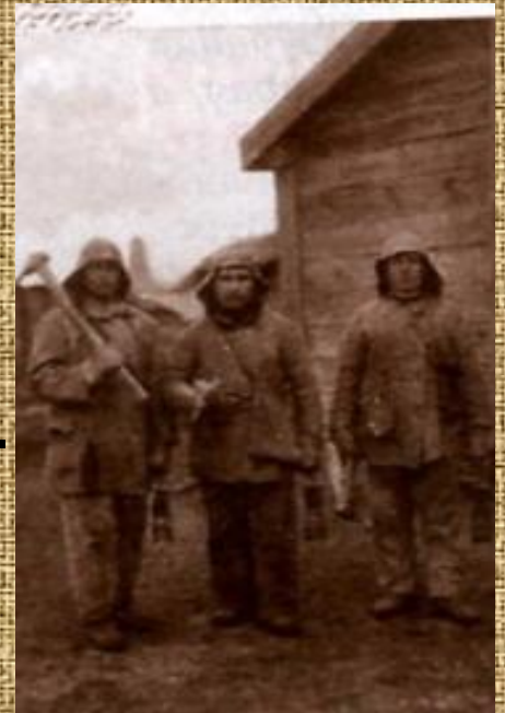
Шахтеры Челябинских копей.

Одним за другим сооружались электрометаллургический комбинат- производитель первых советских ферросплавов ( июль 1931г. ), электролитный цинковый и др.