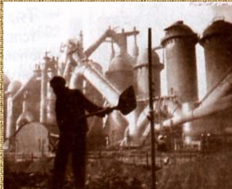
Магнитогорский металлургический комбинат. 1930 –е гг.

Делегаты международного геологического конгресса, посетившие ММК в 1937 году , назвали предприятие « русским чудом ».