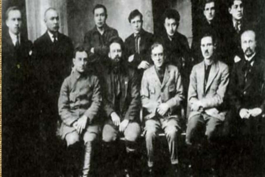
Комиссия по борьбе с голодом. 1922г.

Борьба с голодом была взята под контроль государственных органов и органов местного управления.