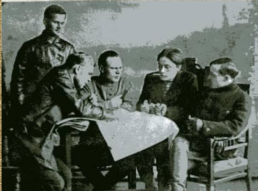
Продпятерка в Челябинске, 1921г.

Осенью 1922г. Стали ощущаться первые результаты изменения аграрной политики большевиков. К 1925 г. сельское хозяйство приблизилось к довоенному уровню производства.