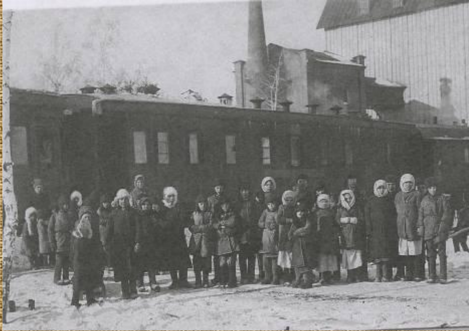
Эвакуация детей в плодородные губернии, г. Челябинск, 1922г.

Не осталось безучастным к трагедии на Южном Урале и мировое сообщество. В Челябинске в 1922г. «Американская администрация помощи» (АРА) открыла 7 столовых на 5 тыс. человек, а молодежная рабочая организация «Межрабпом» кормила в городе 9107 детей. Регулярно прибывала помощь с продовольствием из Китая, Чехословакии и других стран.