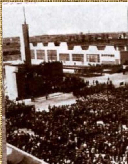
Митинг, посвященный пуску ЧТЗ. 1 июня 1933г.

1 июня 1933 года с конвейера завода сошли первые 13 тракторов.