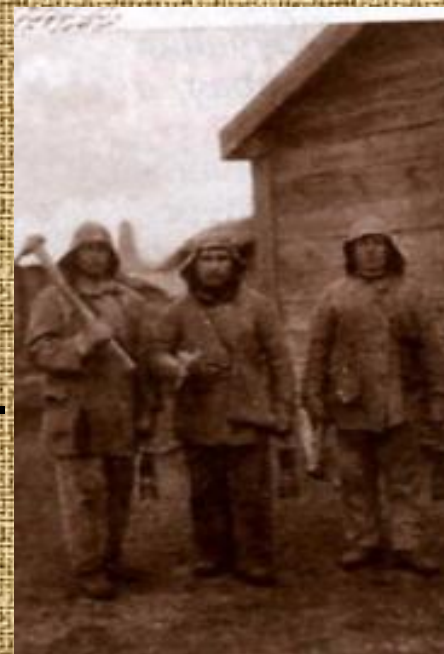
Шахтеры Челябинских копей.

Одним за другим сооружались электрометаллургический комбинат- производитель первых советских ферросплавов ( июль 1931г. ), электролитный цинковый и др.