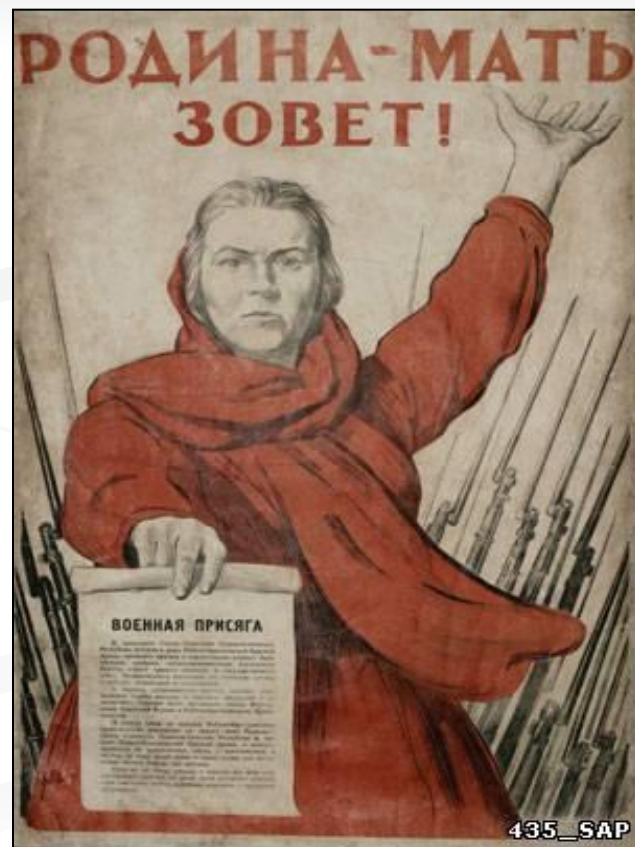
Плакат Ираклия Тоидзе

Откуда в нашей речи появилось изречение: «Родина-мать зовёт!»?