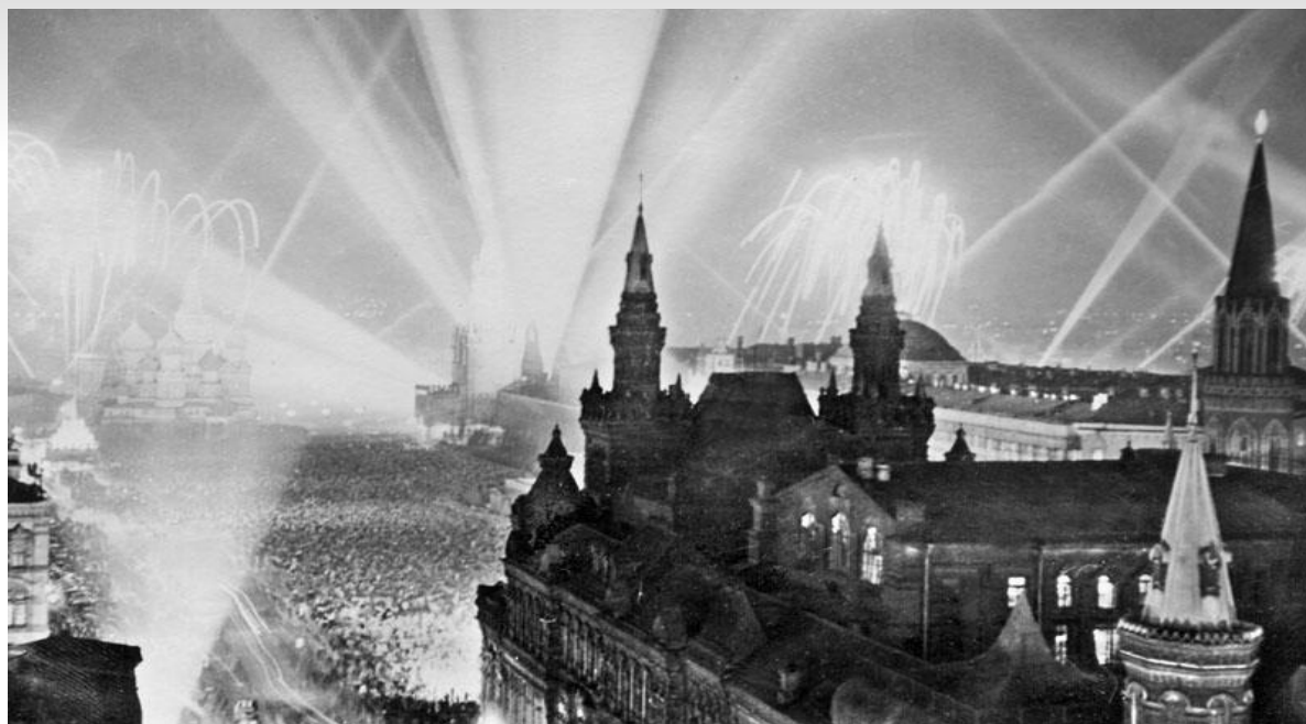
Левитан Юрий Борисович