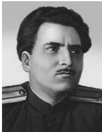
К.М.Симонов, 1941 г. «Жди меня, и я вернусь Всем смертям назло...»