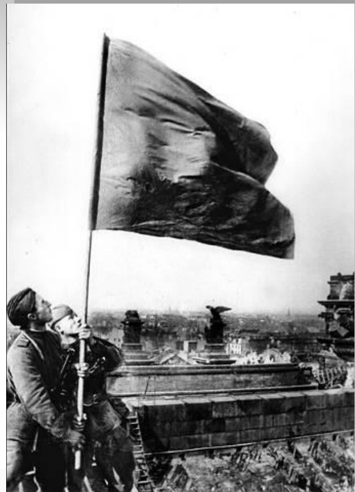
М.А.Егоров и М.В.Кантария