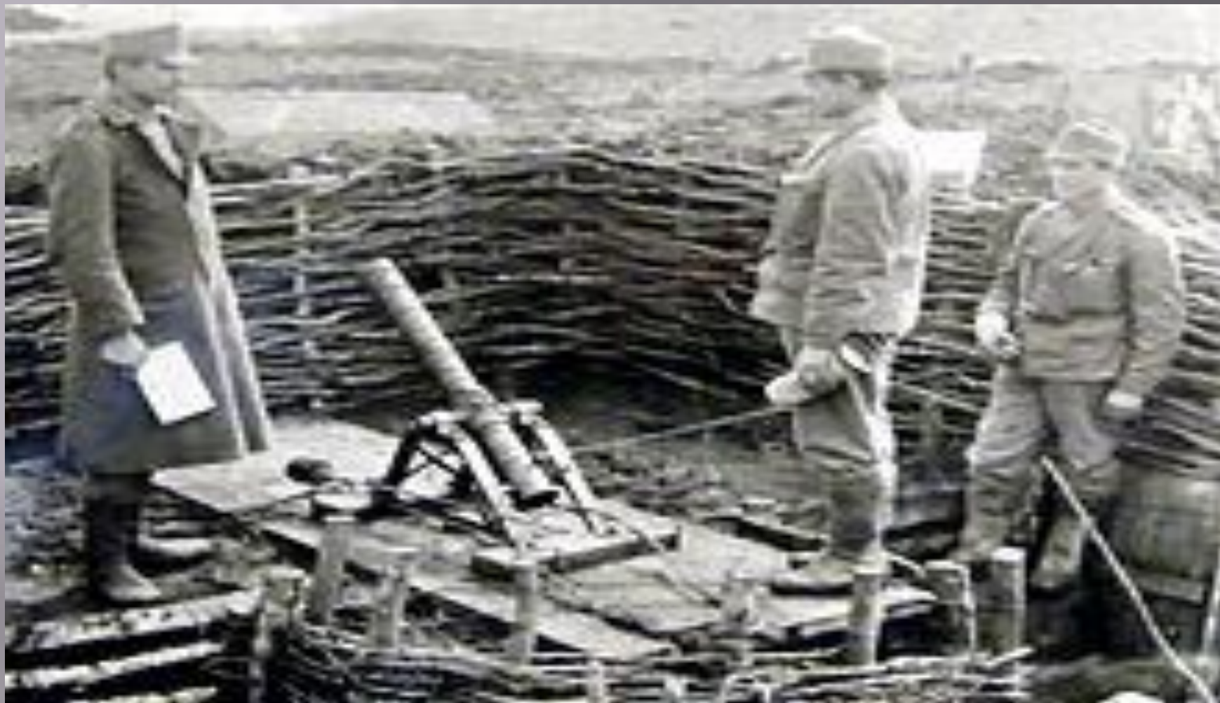
Австрийский миномётный расчёт в орудийном окопе