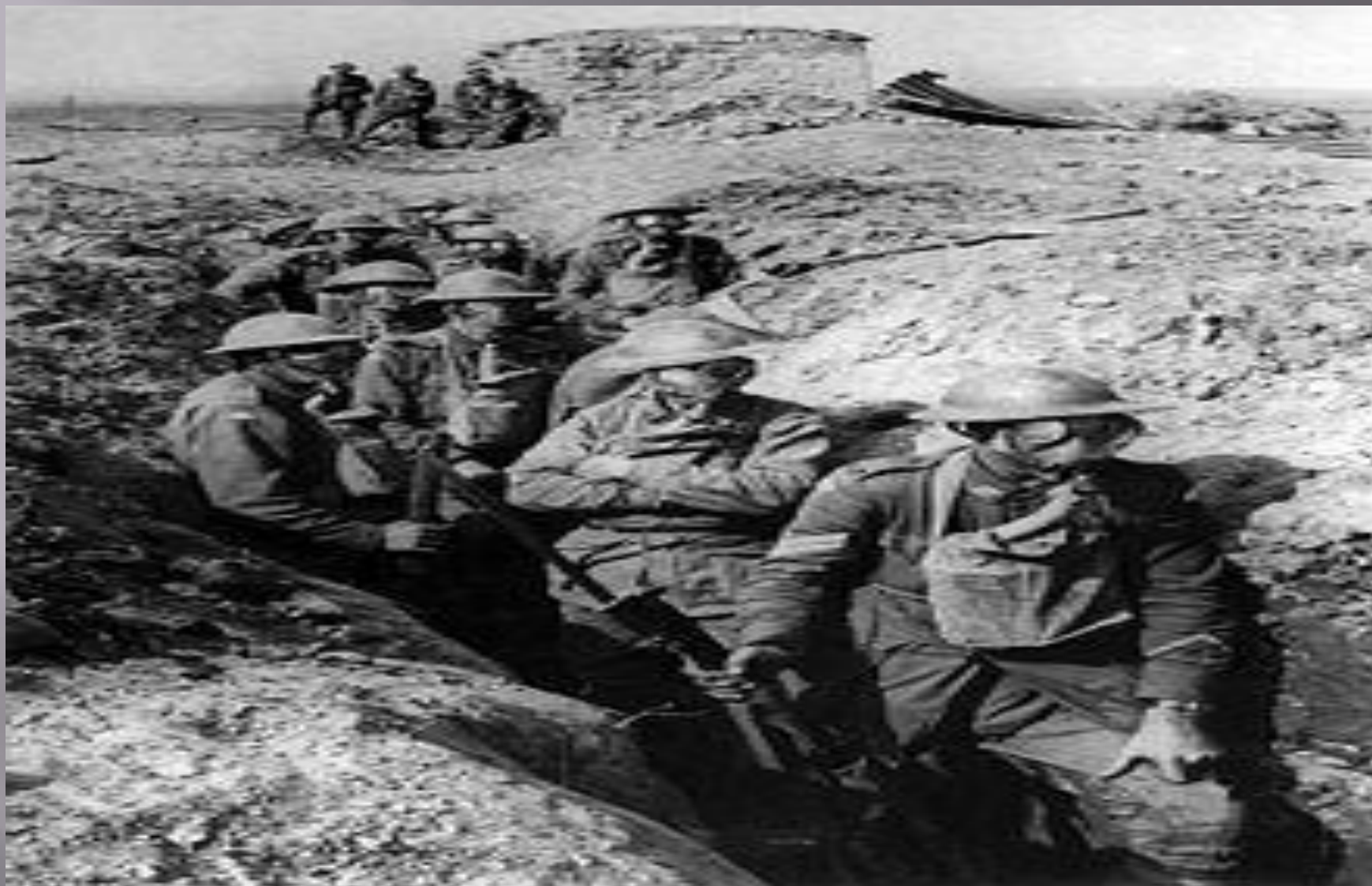
Австралийские солдаты в окопах