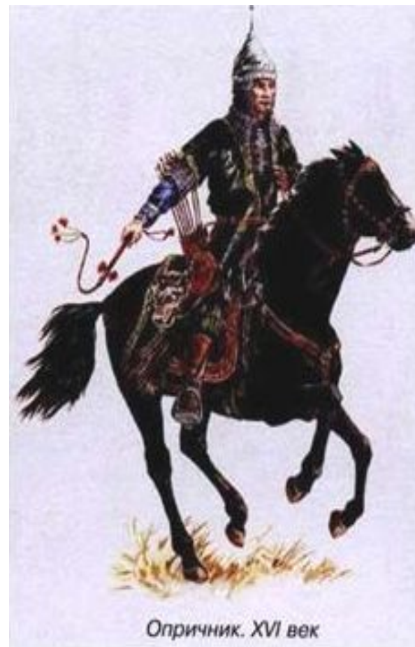
Опричник. XVI век

Черная одежда грубого сукна, прикрепленная к седлу собачья голова и метла, означало, что слуги-опричники подобно псам будут грызть крамольников и выметут всю измену из Московского государства. Всем своим видом опричники наводили ужас на встречных.