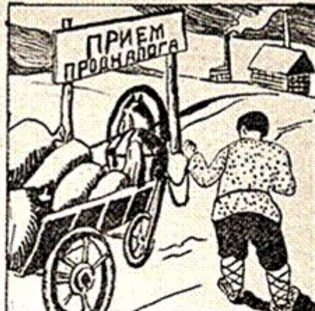
III. Лучше скорей исполни свой долг.