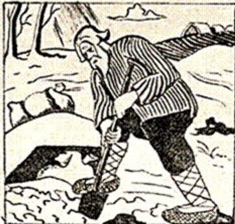
I. Что ты делаешь? Остановись!