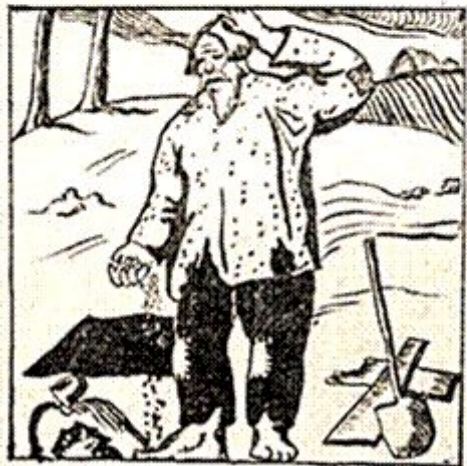
II. Твоя мука сплет — ни себе, ни людям.