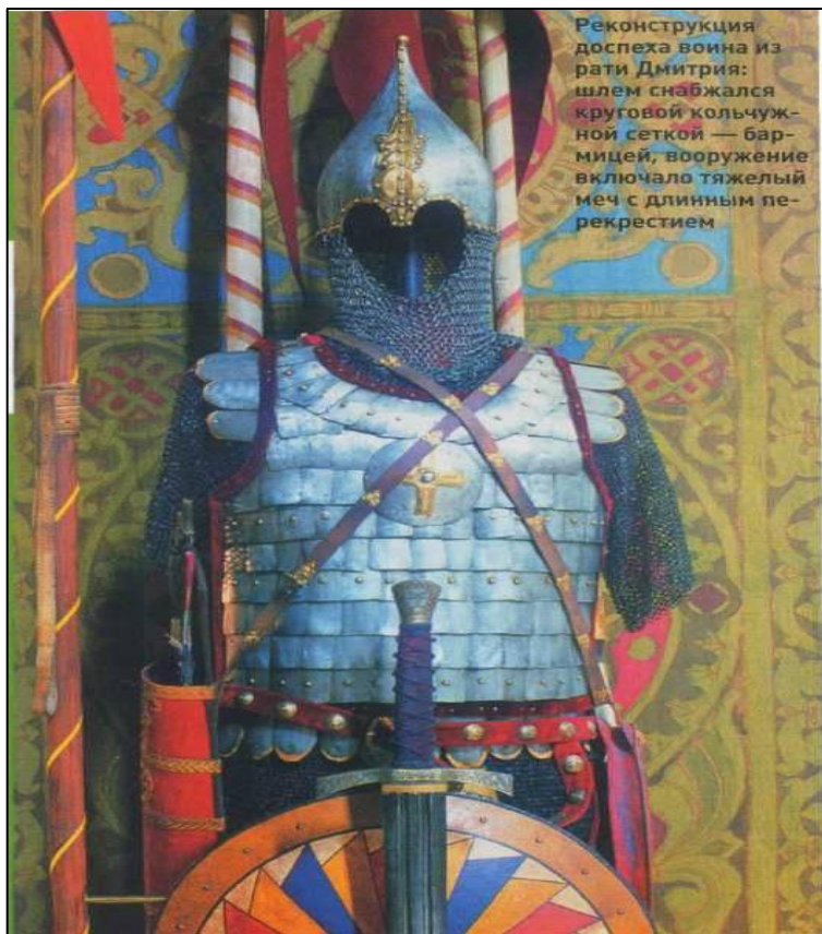
Реконструкция доспеха воина из рати Дмитрия: шлем снабжался круговой кольчужной сеткой — бармицей, вооружение включало тяжелый меч с длинным перекрестием

В «Задонщине» четко указано место битвы — правобережье Дона, и по правой стороне реки Непрядвы.