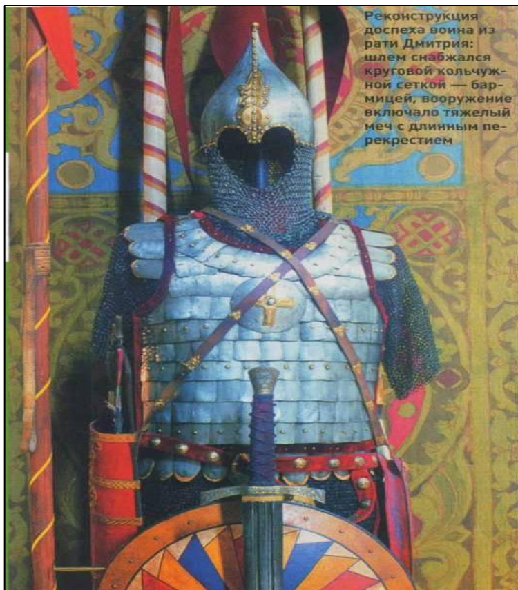
Реконструкция доспеха воина из рати Дмитрия: шлем снабжался круговой кольчужной сеткой — бармицей, вооружение включало тяжелый меч с длинным перекрестием

В «Задонщине» четко указано место битвы — правобережье Дона, и по правой стороне реки Непрядвы.