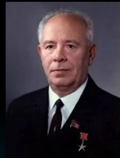
Николай Подгорный - Участник Заговора. Соперник Брежнева в борьбе за место Первого Секретаря.

3) Спустя год после первых ростков заговора, заговорщики уже имели полную информацию о настроениях в стране, и мнении народа о Хрущеве. Заговорщики выясняли что основное недовольство народа связано с аграрными реформами Хрущева. Однако самым сильным катализатором заговора стало известие о том что из-за реформ в сельском хозяйстве к 1965 году в СССР намечался глобальный голод, сравнимый с голодом 1932-33 гг. А так же подготовка к войне с КНР, которая должна была начаться в 1966 году, которая ставила под угрозу целостность СССР, да и его влияние на остальной мир. В этих условиях было обеспечено участие в заговоре Подгорного, и Брежнева, последний неоднократно предупреждал Хрущева об опасности голода, предупреждения были проигнорированы. Теперь против Хрущева был практически весь Президиум ЦК КПСС, и его смещение было делом времени.