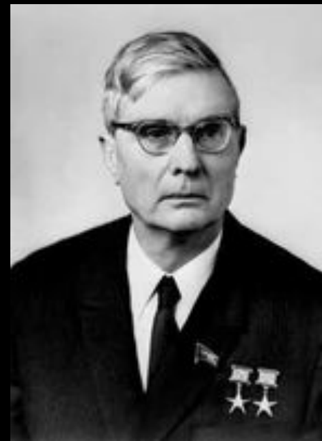
Михаил Суслов - Идейный вдохновитель Заговора.

4) Смещение Хрущева было оговорено, и намечено на Ноябрьский Пленум ЦК КПСС. Он ставил вопрос об замене Малиновского на командующего Киевским военным округом Петра Кошевого. Это ускорило темпы подготовки к смещению Хрущева, и теперь по предложению Брежнева Хрущева должны были снять уже в Октябре, во время внеочередного Пленума ЦК. Так же был вариант физического устранения Хрущева. Подготовкой доклада, и речи на этот счет занимался будущий Серый Кардинал Михаил Суслов. При этом менее чем за 5 месяцев в этом политическом клише на верх выдвинулось две фигуры, не смотря на власть Шелепина, и главенство Малиновского, этими фигурами стали Николай Подгорный, и Леонид Брежнев.