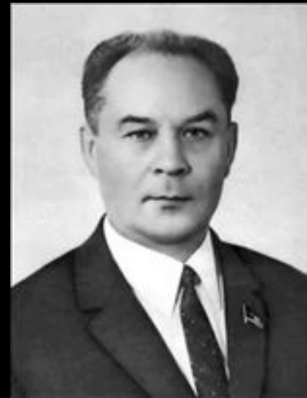
Александр Шелепин - Лидер крупной внутрипартийной группировки "Комсомольцев".

Первый из этого клише не устраивал практически никого, так как Подгорных был человеком надменным, и крайне самоуверенным, и тем более не достаточно умным. Брежнев же устраивал группировку Косыгина-Полянского, и военных Малиновского, что давало ему очевидные преимущества. Кроме того Брежнев во главу угла своей политической программы ставил свертывание реформ Хрущева, увеличения бюджета Военно-Промышленного Комплекса что на тот момент было жизненно важно для СССР, а так же умеренные мирные инициативы которые способствовали бы сохранению внешней политики СССР и даже бы вывели её на новый уровень. В целом этот вопрос оставался нерешенным вплоть до 11 октября, так как Шелепин и Комсомольцы ни как не могли решить за кого отдавать свой голос. В конечном итоге Шелепин поддержал Брежнева.