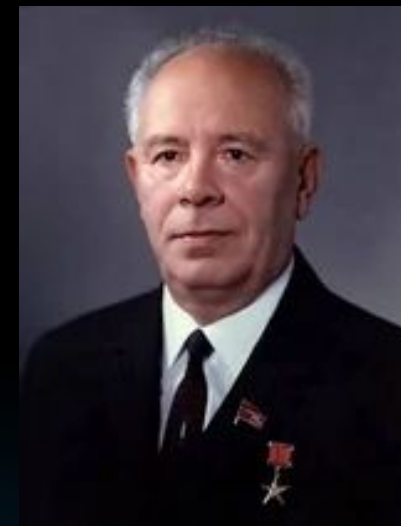
Николай Подгорный - Участник Заговора. Соперник Брежнева в борьбе за место Первого Секретаря.

3) Спустя год после первых ростков заговора, заговорщики уже имели полную информацию о настроениях в стране, и мнении народа о Хрущеве. Заговорщики выясняли что основное недовольство народа связано с аграрными реформами Хрущева. Однако самым сильным катализатором заговора стало известие о том что из-за реформ в сельском хозяйстве к 1965 году в СССР намечался глобальный голод, сравнимый с голодом 1932-33 гг. А так же подготовка к войне с КНР, которая должна была начаться в 1966 году, которая ставила под угрозу целостность СССР, да и его влияние на остальной мир. В этих условиях было обеспечено участие в заговоре Подгорного, и Брежнева, последний неоднократно предупреждал Хрущева об опасности голода, предупреждения были проигнорированы. Теперь против Хрущева был практически весь Президиум ЦК КПСС, и его смещение было делом времени.