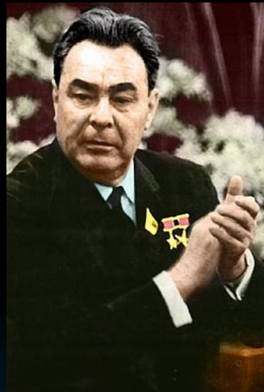
Леонид Ильич Брежнев

На утро 13 октября на голосовании был единогласно и официально назначен на пост Первого Секретаря ЦК КПСС Леонид Ильич Брежнев. Во время пленума Анастас Микоян пробовал аккуратно защитить Хрущева перечисляя его положительные стороны, однако это вызвало крайне отрицательную реакцию со стороны остального президиума, что стало причиной краха карьеры сталинского наркома. Об смещении Хрущева было официально объявлено спустя два часа после принятия соответствующего решения.