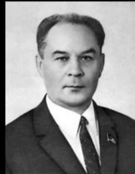
Александр Шелепин - Лидер крупной внутрипартийной группировки "Комсомольцев".

Первый из этого клише не устраивал практически никого, так как Подгорных был человеком надменным, и крайне самоуверенным, и тем более не достаточно умным. Брежнев же устраивал группировку Косыгина-Полянского, и военных Малиновского, что давало ему очевидные преимущества. Кроме того Брежнев во главу угла своей политической программы ставил свертывание реформ Хрущева, увеличения бюджета Военно-Промышленного Комплекса что на тот момент было жизненно важно для СССР, а так же умеренные мирные инициативы которые способствовали бы сохранению внешней политики СССР и даже бы вывели её на новый уровень. В целом этот вопрос оставался нерешенным вплоть до 11 октября, так как Шелепин и Комсомольцы ни как не могли решить за кого отдавать свой голос. В конечном итоге Шелепин поддержал Брежнева.