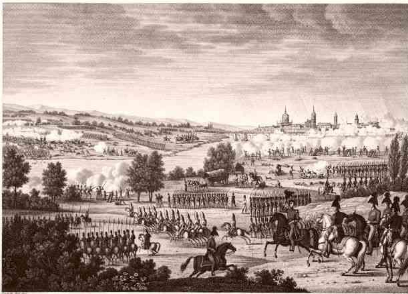
BATAILLE DE DRESDEN, LIVRÉE LE 26 AOÛT 1813.