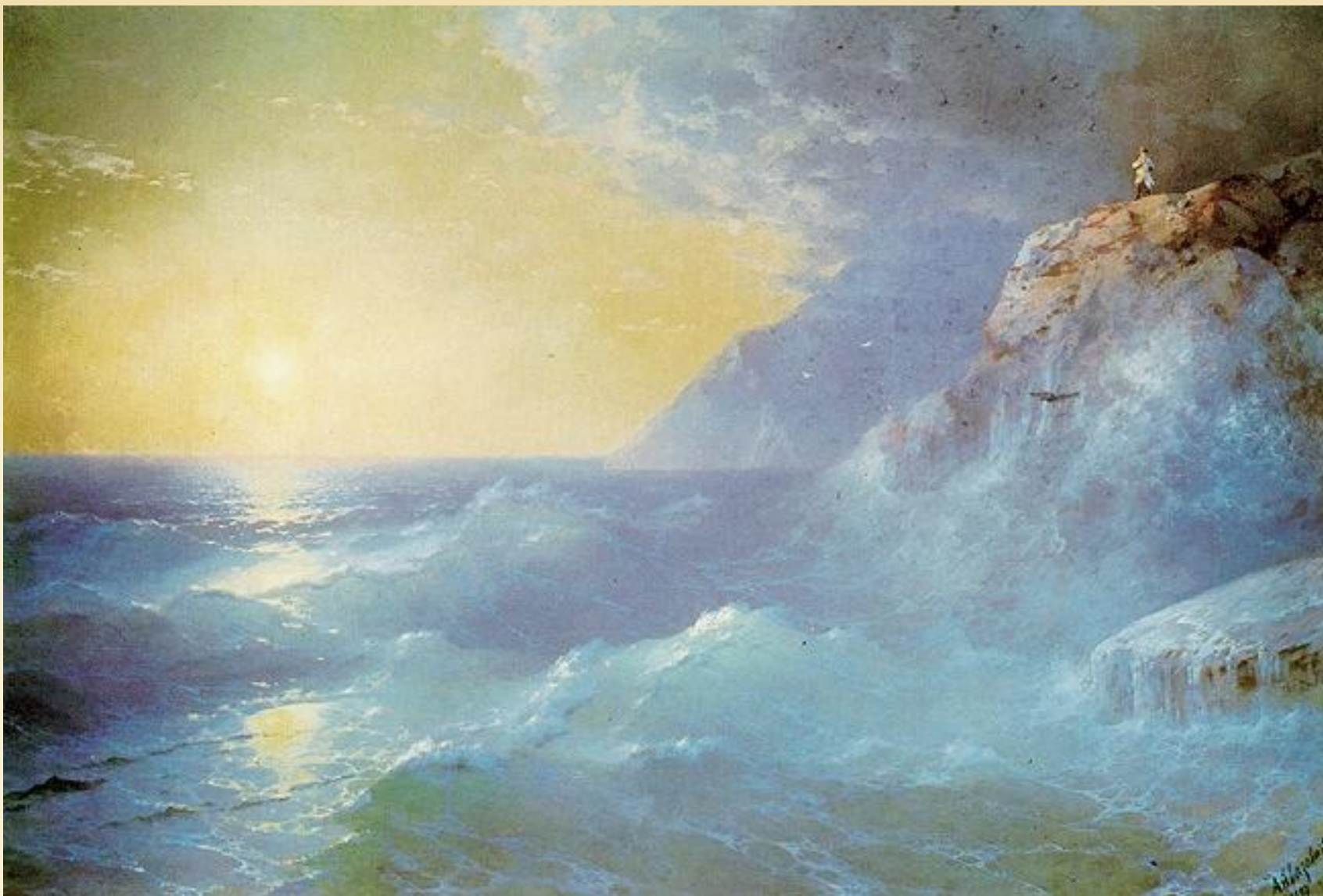
И. Айвазовский. Наполеон на острове святой Елены