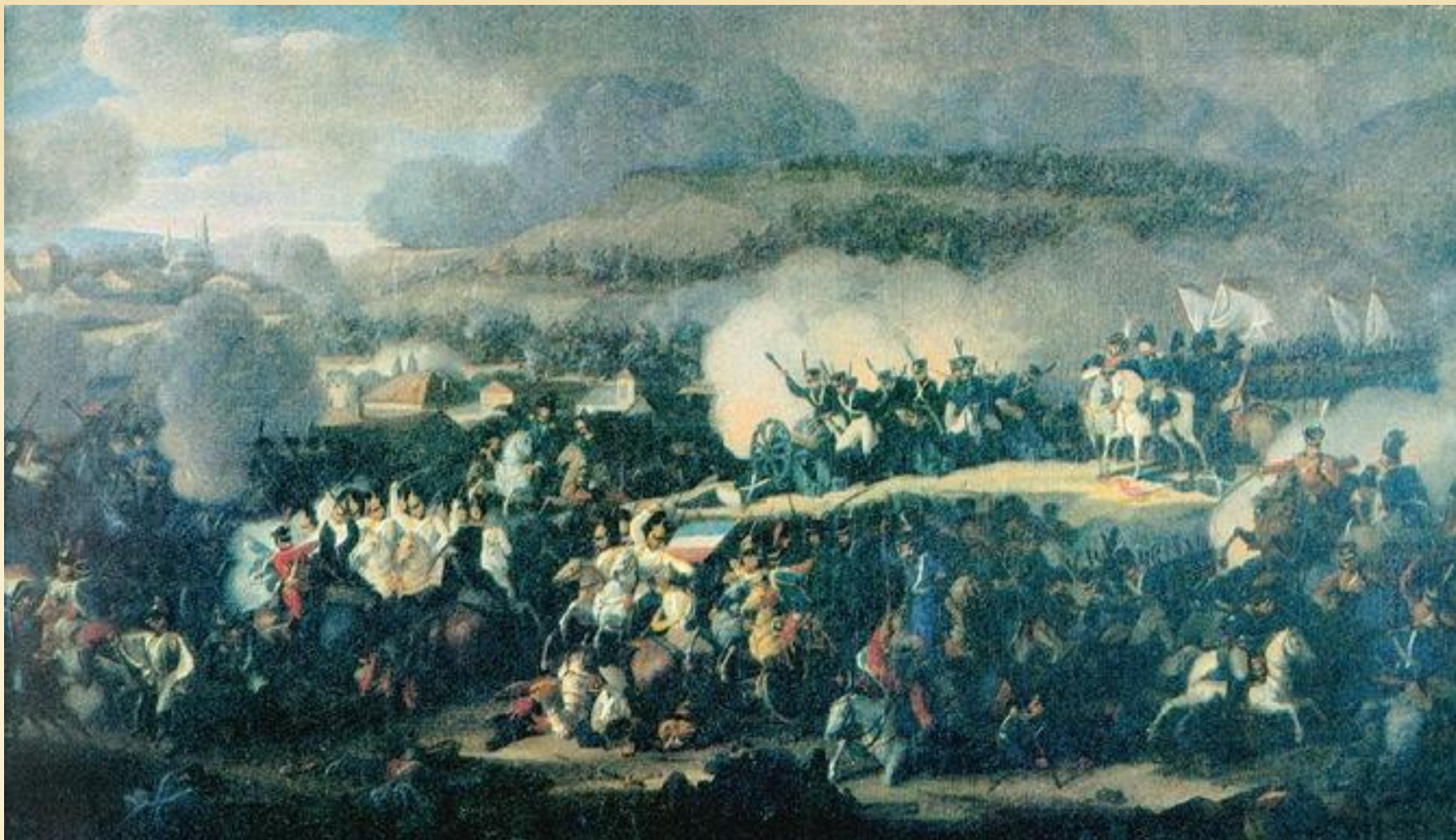
В. Машков. Сражение под Лейпцигом