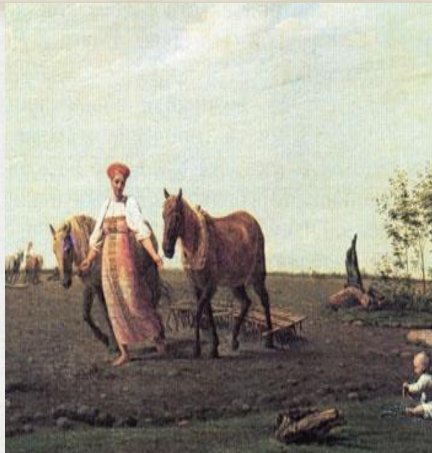
А. Венецианов. "На пашне".

Предполагаемый указ о полном запрете Юрьева дня. Сам указ не сохранился, но существуют косвенные свидетельства его существования.