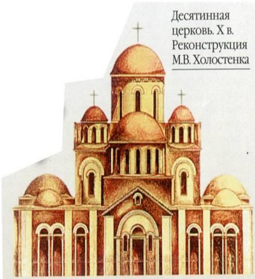
Десятинная церковь. X в. Реконструкция М.В. Холостенка