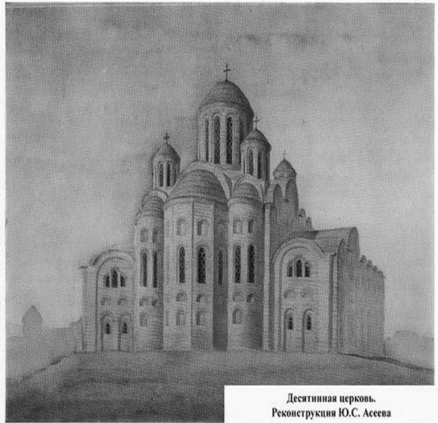
Десятинная церковь. Реконструкция Ю.С. Асеева