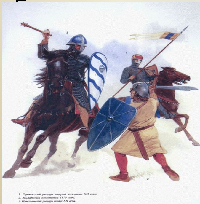
1. Германский рыцарь второй половины XII века. 2. Миланский пехотинец 1170 года. 3. Итальянский рыцарь конца XII века.