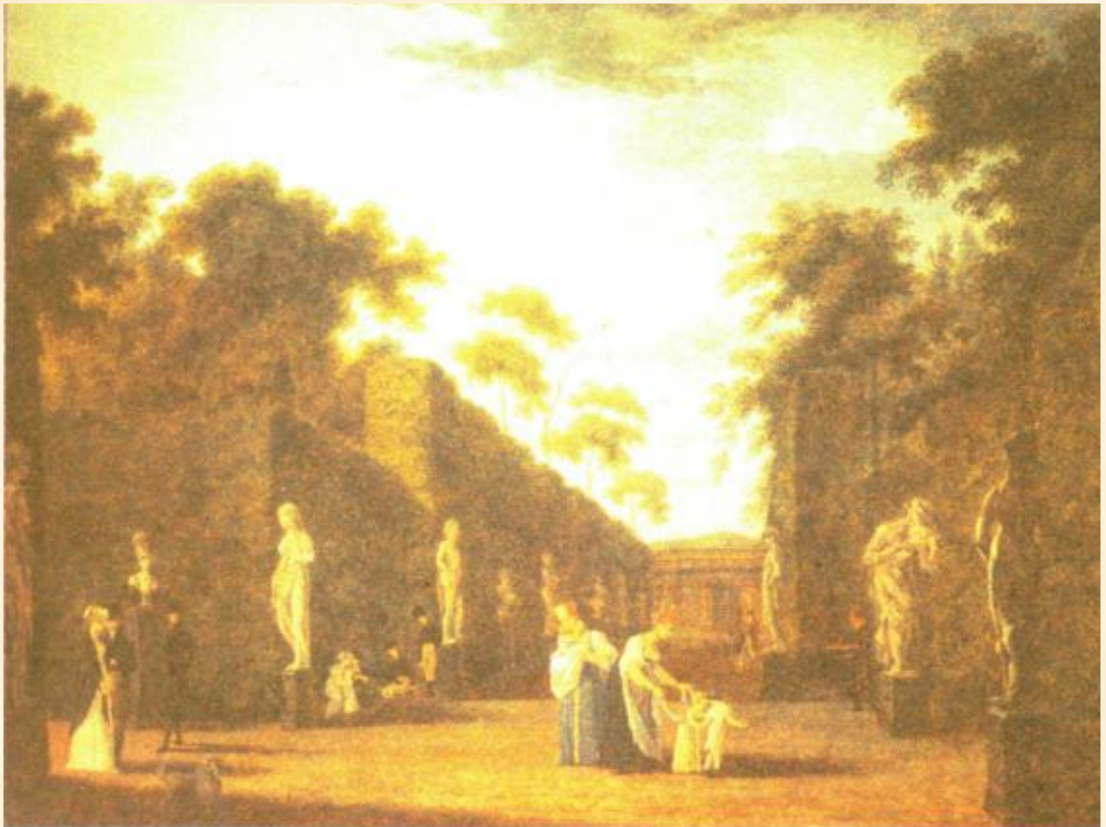
Летний сад в Петербурге