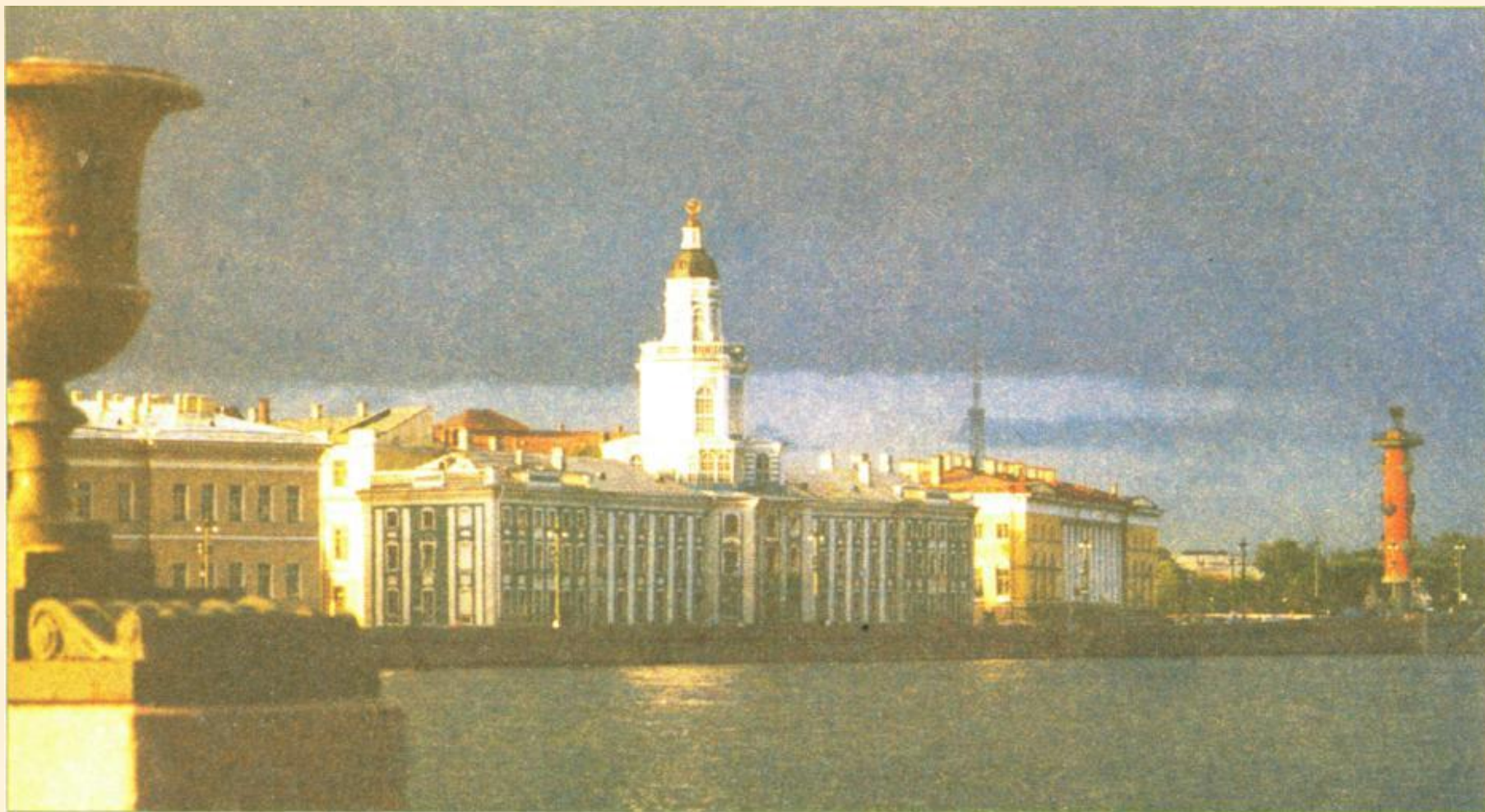
Вид на Кунсткамеру с Адмиралтейской набережной