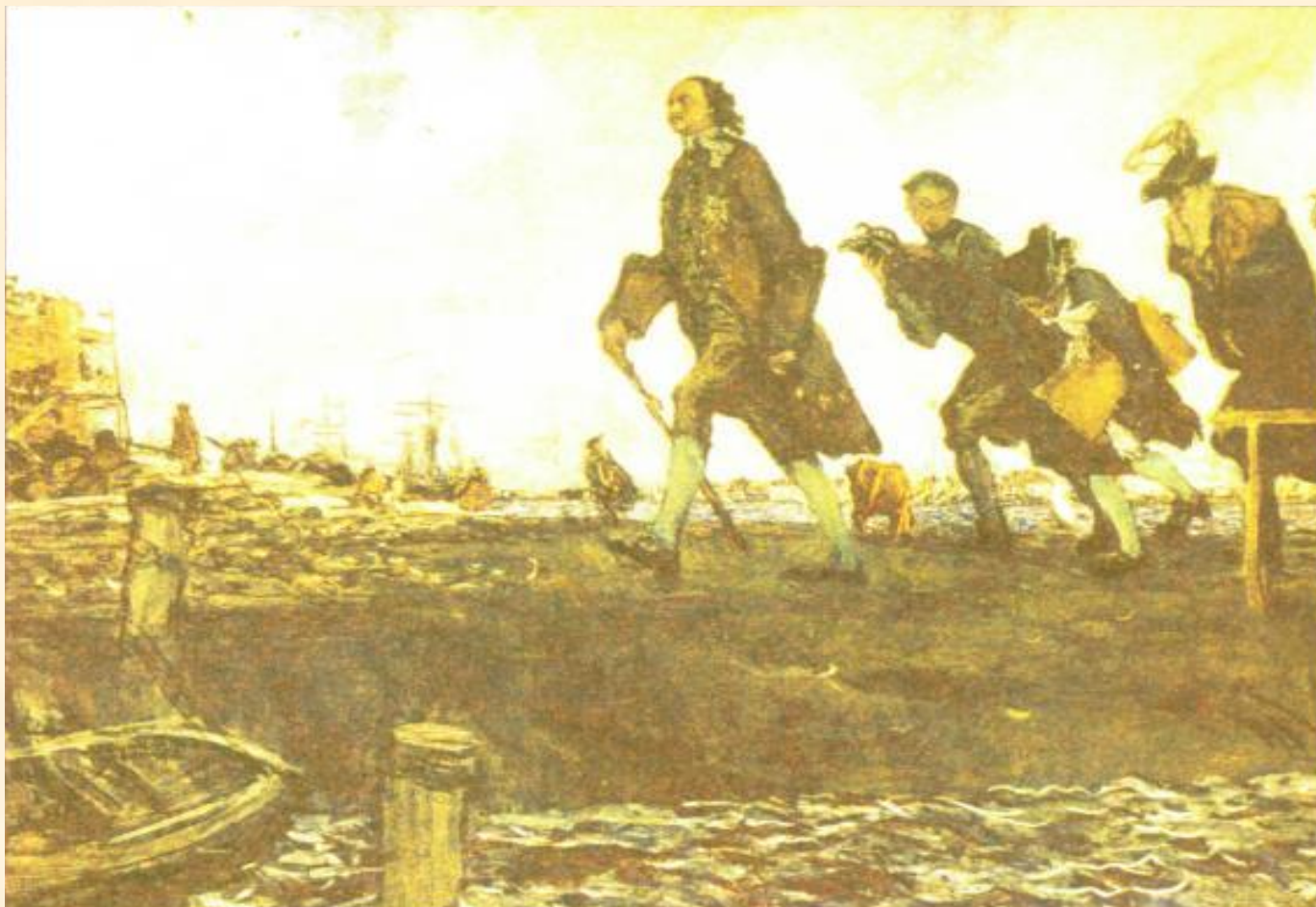
Пётр Первый на строительных работах