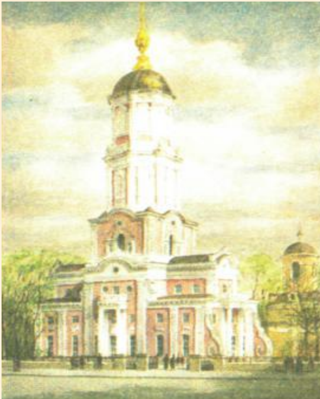
Церковь архангела Гавриила