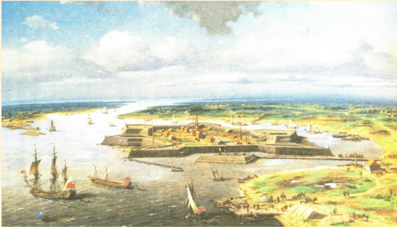
Санкт-Петербург. Первые годы