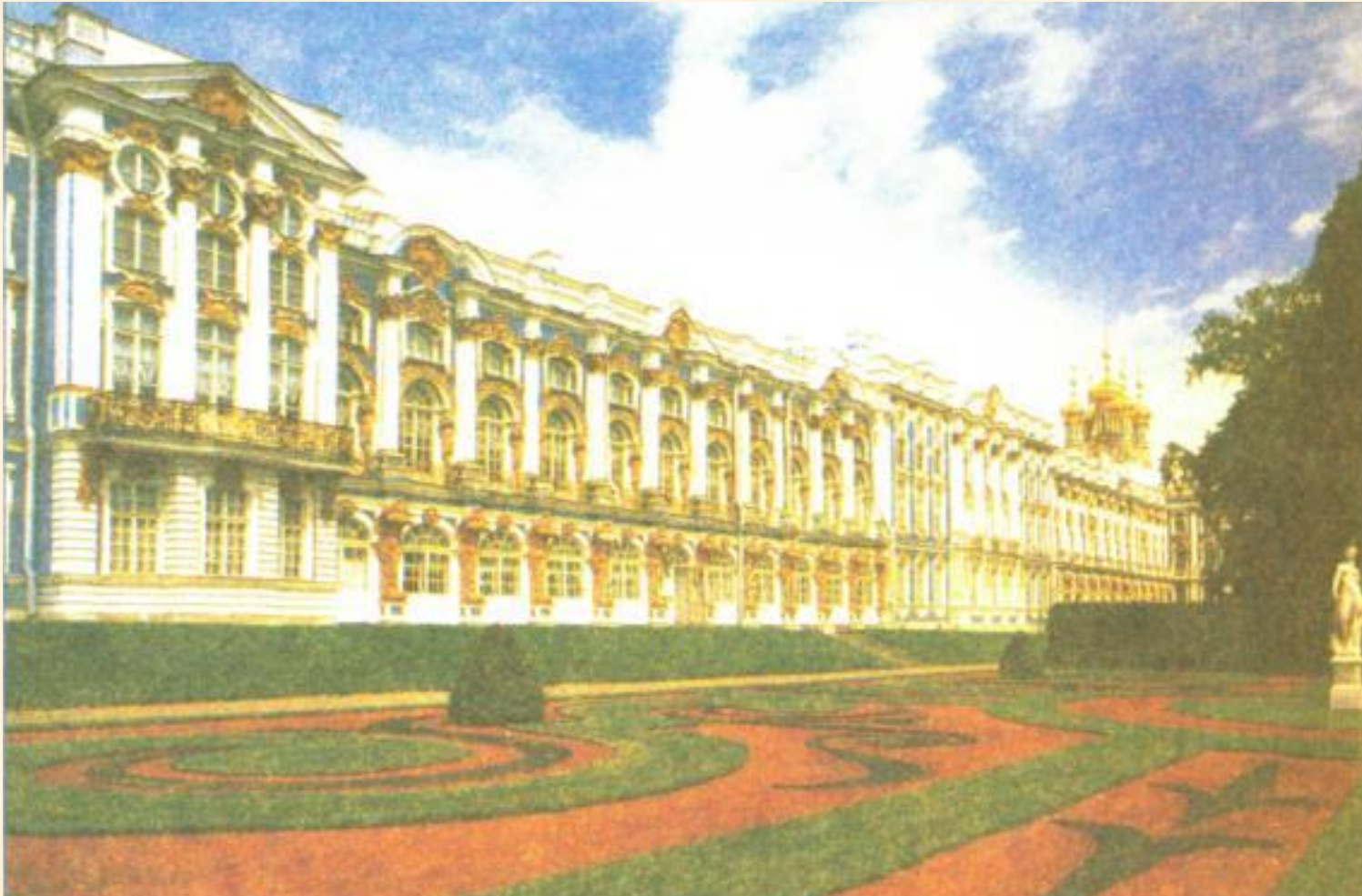
Царское село. Большой Екатерининский дворец