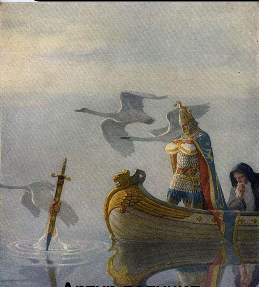
Артур получил Экскалибур от Девы Озера