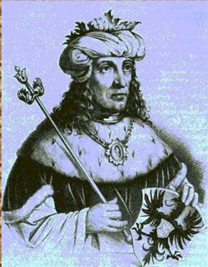
Генрих I Птицелов – первый германский король