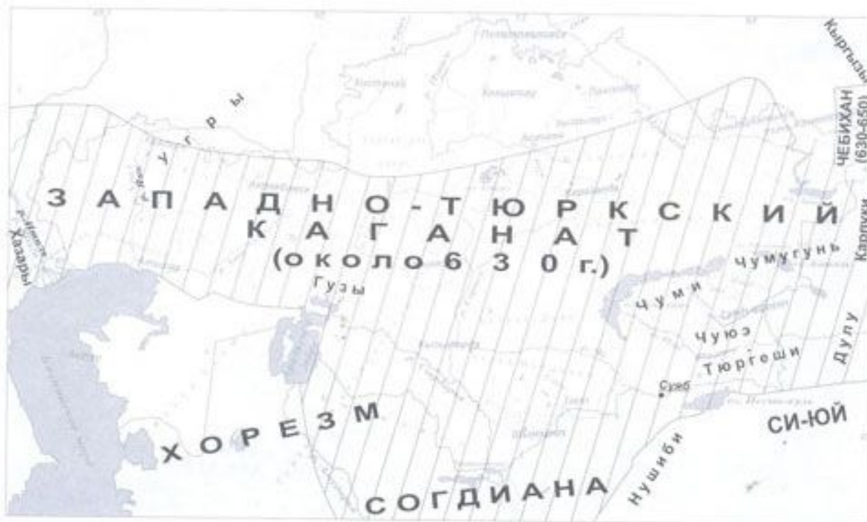
Западно-Тюркский каганат (630 г.)