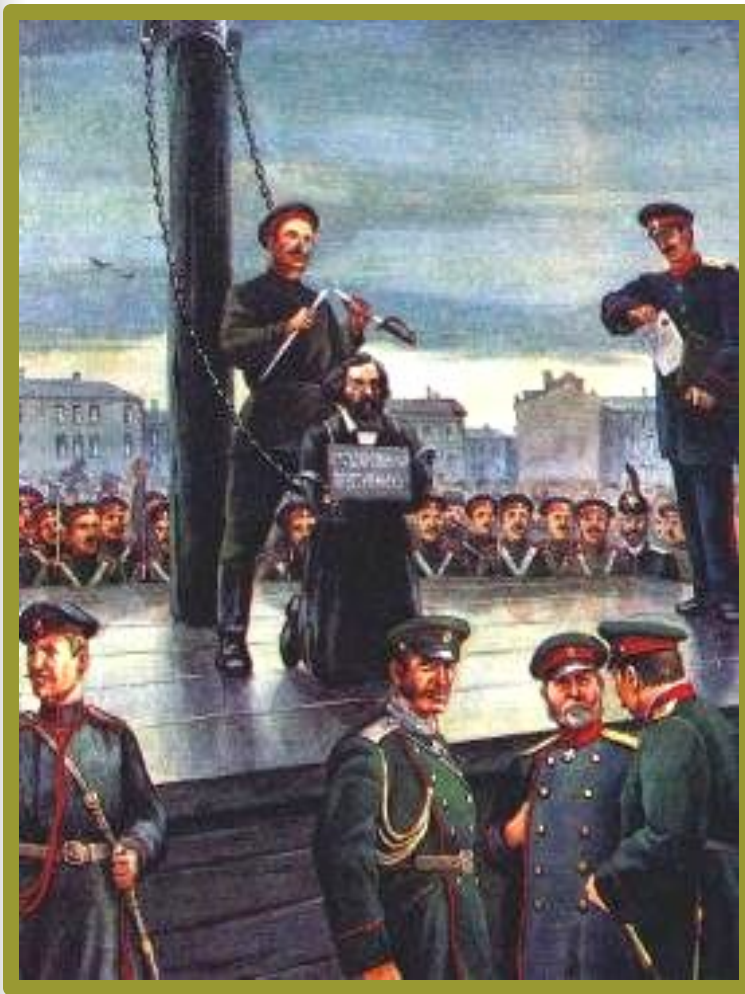
Гражданская казнь Н.Г.Чернышевского

В 1864г. Над ним была совершена гражданская казнь.