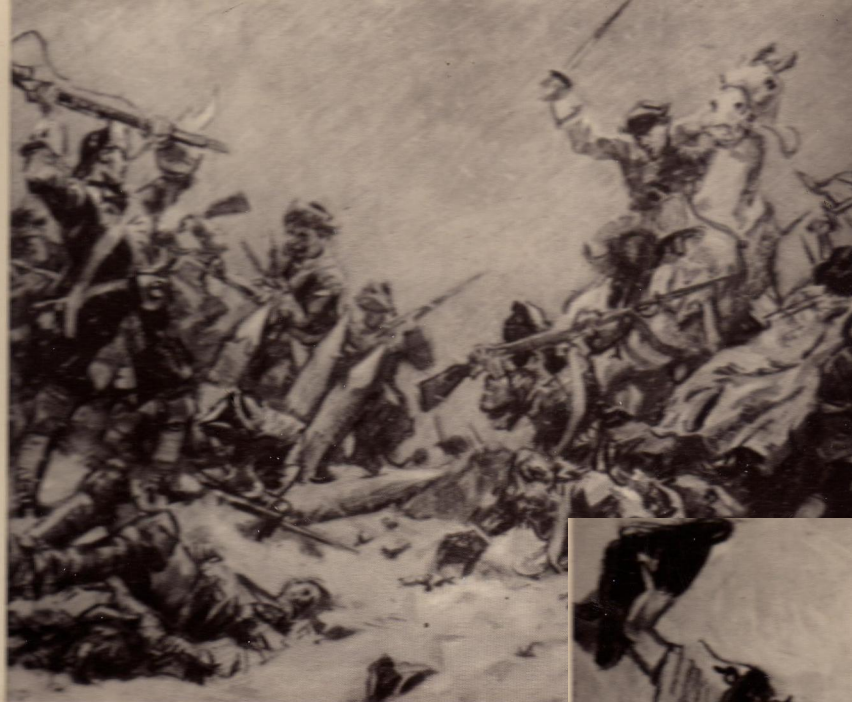
Полтавская битва. 1709 год