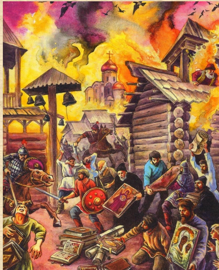
Разорение Москвы Тохтамышем.