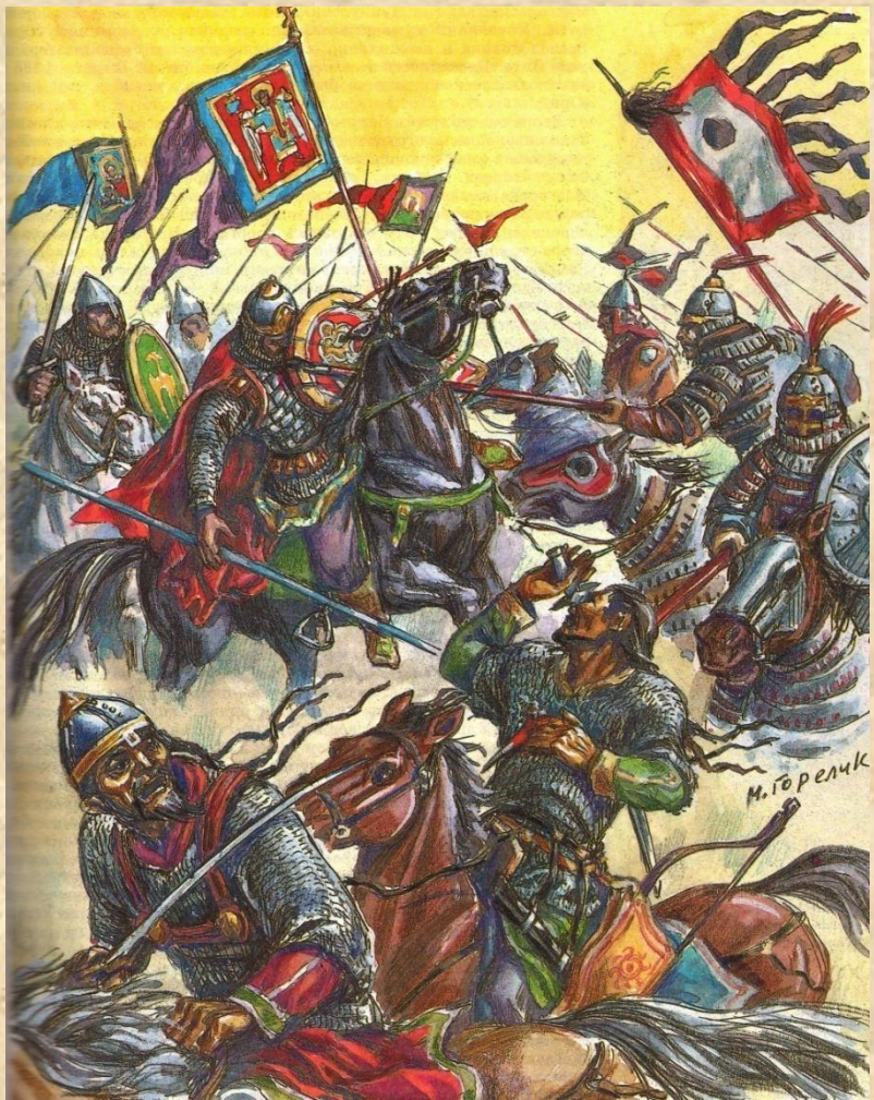
Битва на реке Калке. 1223 год.