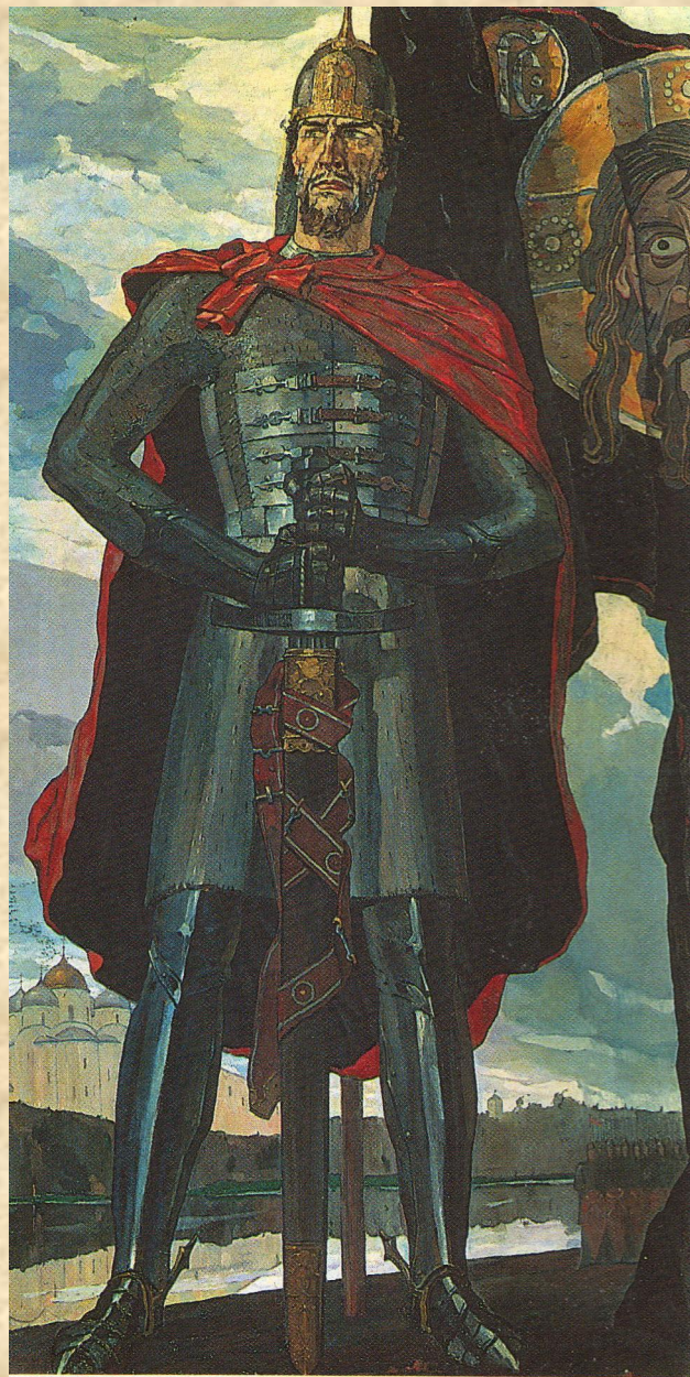
Д. Корин. «Александр Невский».