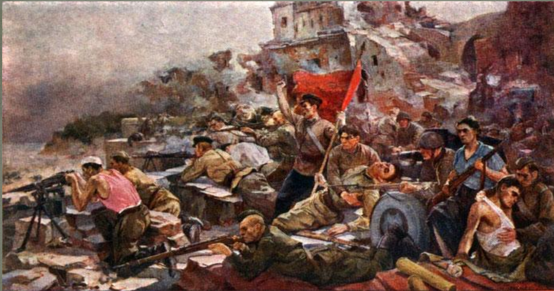
Е Зайцев. Оборона Брестской крепости.

Около месяца продолжалась героическая оборона. Ничто не сломило волю и мужество гарнизона.