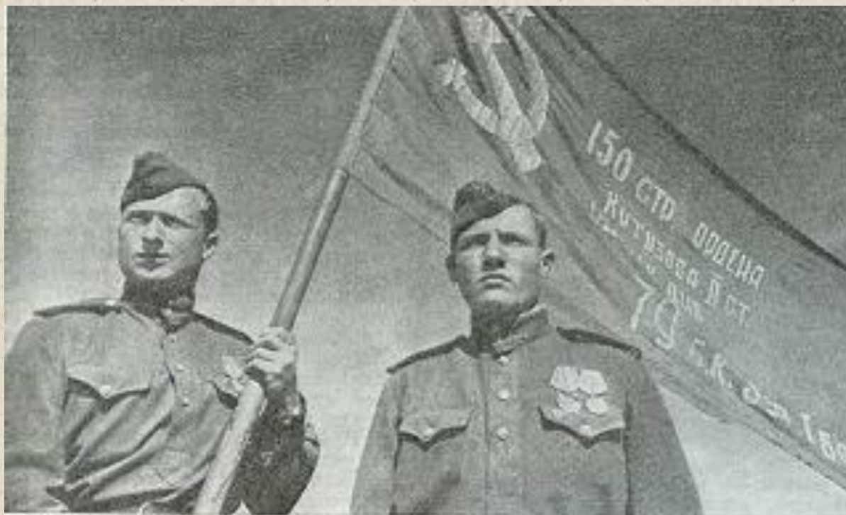
Разведчики 756-го полка 150-й стрелковой дивизии М. А. Егоров (справа) и И. В. Кантарин со Знаменем Победы, Берлин, Май 1945,

Знамя Победы над Рейхстагом водрузили М. Егоров и М. Кантария