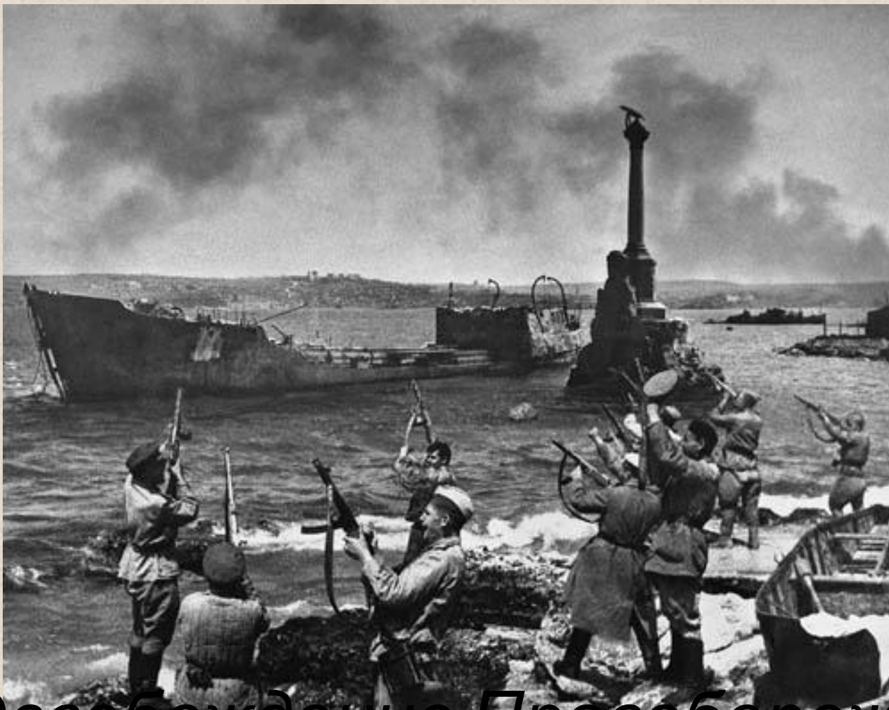
Освобождение Правобережной Украины (февраль-март 1944)