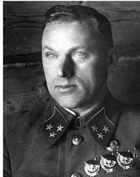
К. К. Рокоссовский 2-й Белорусский фронт