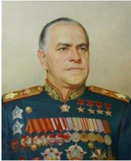
Г.К. Жуков 1-й Белорусский фронт