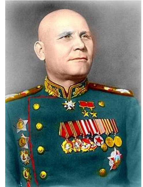
И. С. Конев 1-й Украинский фронт