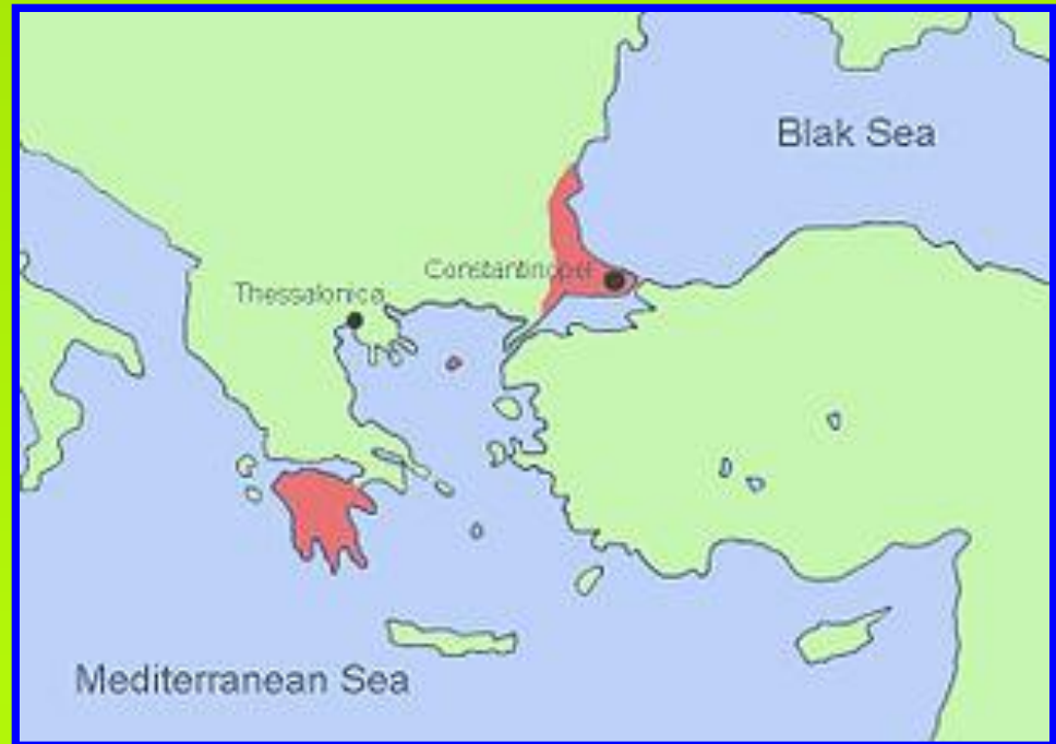
Византия к 1450 г.

К середине XV века Византия потеряла все свои владения. Император владел только городом Константинополь и небольшими территориями в Греции. Жители Византии были недовольны заключенной с католиками унией и не поддерживали власть императора.