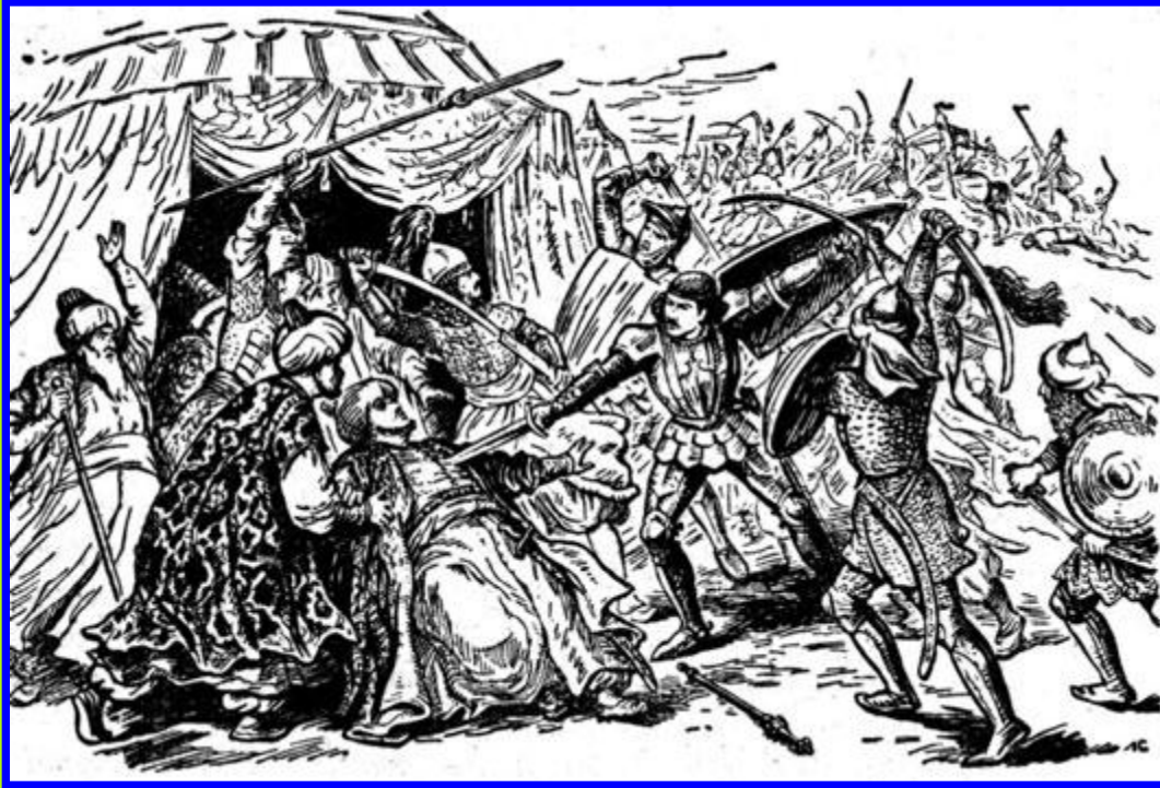
Милош Обилич убивает турецкого султана

В 1389 г. войско османов вторглось в Сербию. Решающая битва произошла на Косовом поле. Милош Обилич сумел пробраться в стан врага и убил султана, но сын султана принял командование, ввел в бой резервы и смог разгромить сербов.