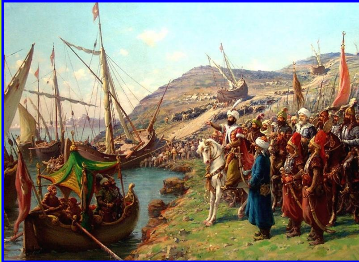
Султан Мехмет II

В 1453 г. турецкий султан Мехмет II собрал огромную армию (до 150 тыс.чел.) и осадил Константинополь. Император Константин смог выставить на защиту города лишь около 7 тыс.человек (большинство наемники).