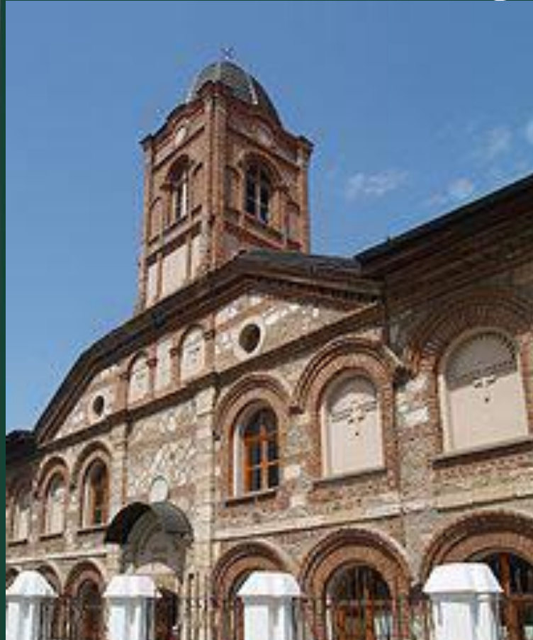
Болгарская церковь Святого Георгия

Убедившись в слабости Балканских стран, османы перешли от набегов к завоеваниям. Захватив значительную часть византийских владений в Европе, они перенесли свою столицу в Адрианополь. Император должен был признать султана вассалом и платить ему дань.