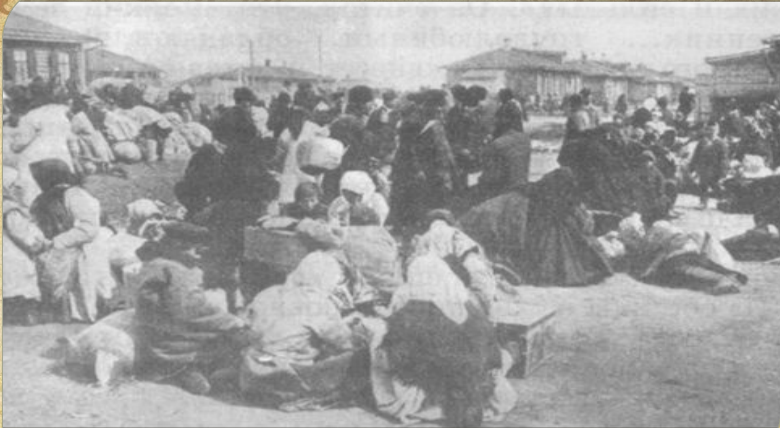
Крестьяне – столыпинские переселенцы на переселенческом пункте, 1908 год.