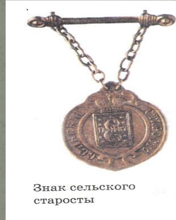
Знак сільського старости