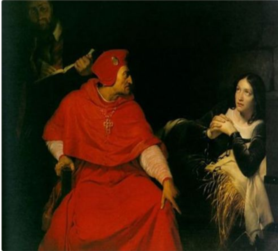
Допрос Жанны кардиналом Винчестера (Поль Деларош, 1824 год)